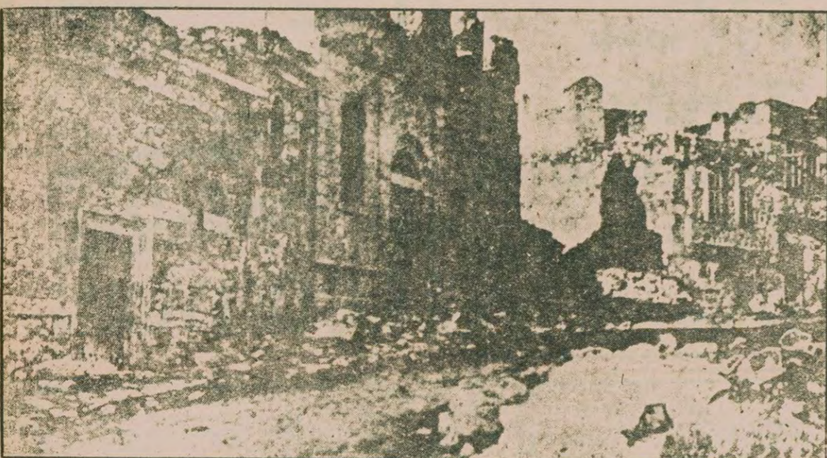
İşgale uğrayan bütün Doğu vilayetleri gibi Erzurum da nasibini alıyor ve şehirde yanmış, yıkılmış evlerden geçilmeyordu

"Kürt aşiretlerinden bazılarının İngilizlerden ve yaptıklarında hoşlanmıyordu. Bir detasında propaganda yapan bir İngiliz aşiretler tarafından öldürülmüştü. Zaho'da da bu uğurda da bir İngiliz yetkilisi hayatını kaybetmişti"