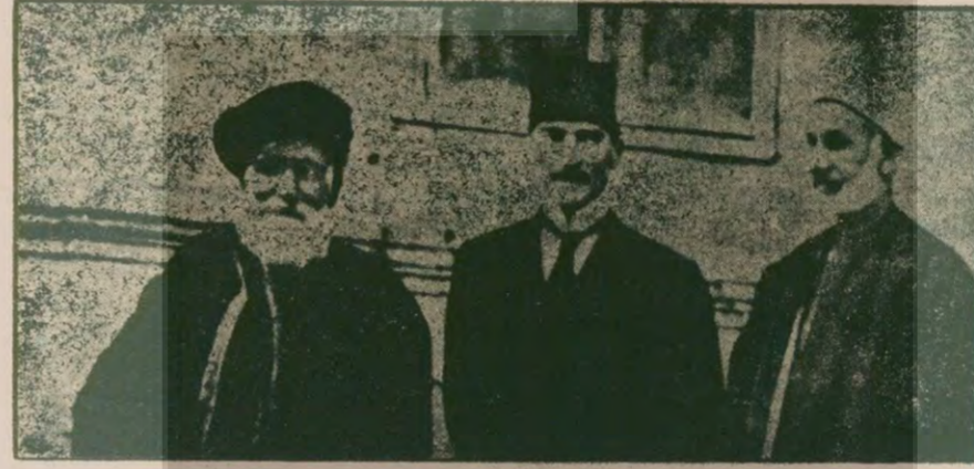
Mondros Mütarekesinden sonra Kürtlere bağımsızlık sloganıyla ortaya çıkan İngilizler, bir yandan da Doğu'yu işgal ediyorlardı. Urfa, Antep, Maraş, Bilecik, Kars ve Batum işgal edilmişti. Musul Kürtleri İngiliz bombardıman uçaklarıyla sindirilmeye çalışılıyor. Bu sırada M. Kemal Erzurum'a geliyordu. Türk ve Kürtlerin birliği yolunda ilk adım atılıyordu.

destekliyordu. Bunlar nasıl birleşecek ve işgalcileri kovacak, boyunlarına zincirlemek istenen esaret zincirini kıracaklardı?