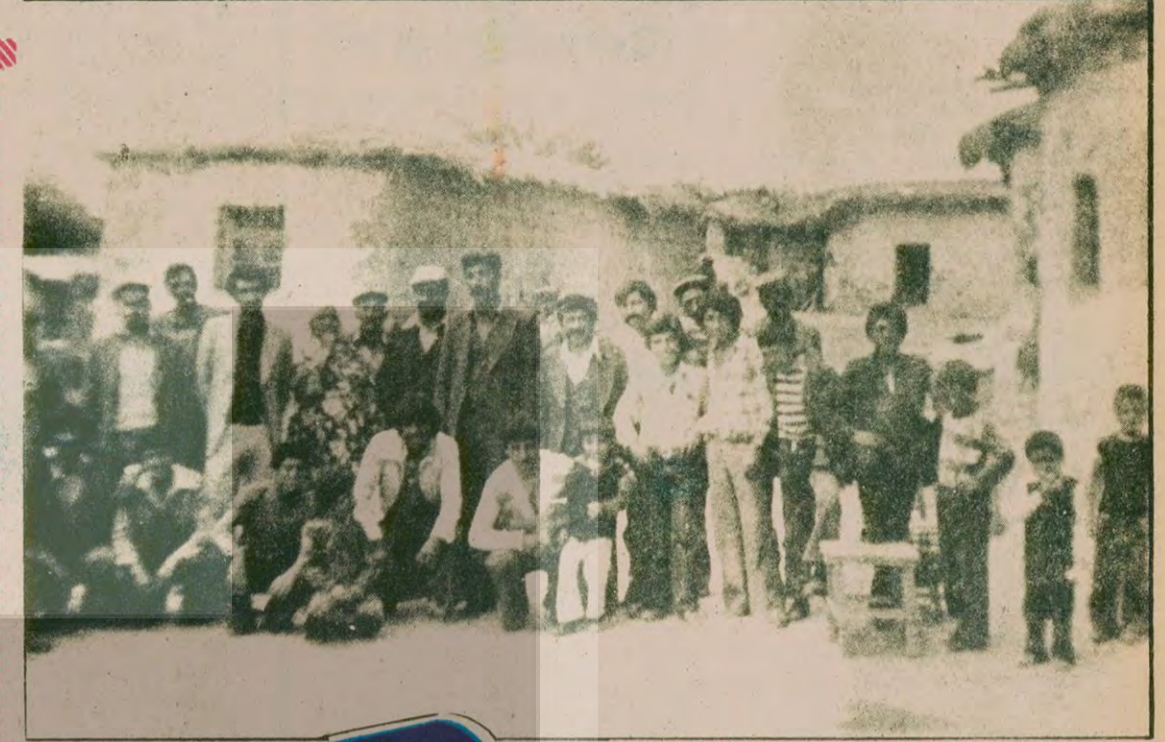
Topraklar bizim dedik. jandarma bastı. İmdatma yetiştirdi ağamın.

Toprakları, jandarma desteğiyle Ağa tarafından gasp edilen Çatal ve Kelemo köylüleri: