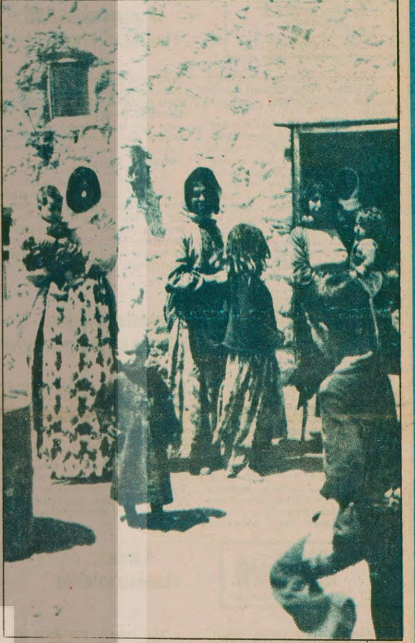
Yine jandarma basmış, erkekler atılmış ciplere gitmişler. Kadınlar kalmas- köyde. Bir de çocuklar... Kadınlar "erkeklerimizin adı mahkuma çıktı" diyorlar " Hep böyle, hep böyle, jandarma gelir. Hep böyle..."