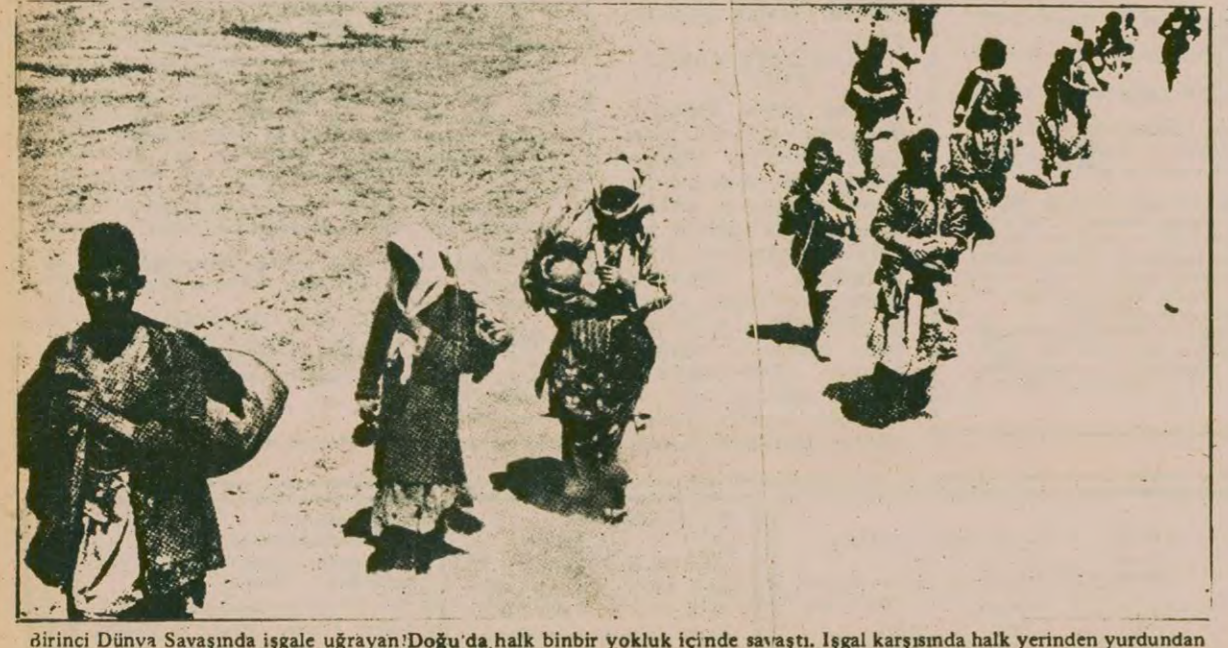
Birinci Dünya Savaşında işgale uğrayan Doğu'da halk binbir yokluk içinde savaşı. İşgal karşısında halk yerinden yurdundan oldu. Yukarıda işgal üzerine göç eden Kürt köylüleri görülüyor.

İngilizler Kürtlere el atıyor İstanbul'da Hüriyet Mustafa Kemal'in birlik çağrısı Mustafa Kemal ise ver-