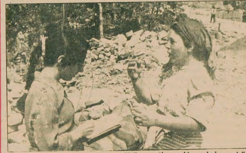
"Kocanın etindeki izmarit lağımına düşünce patlama oldu ve kolu yandı"