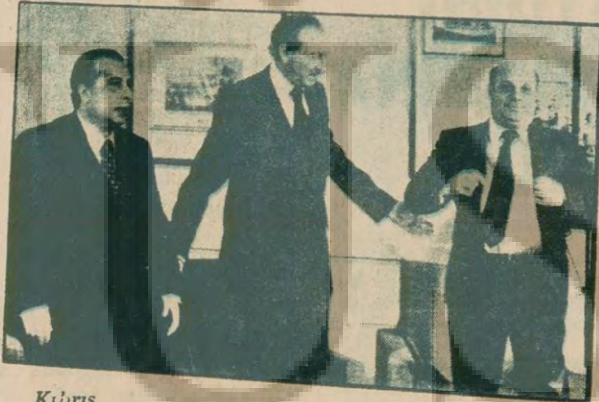
Kıbrıs Zirvesi BM Genel Sekreteri Kurt Waldheim'in gözetiminde dün başladı. Waldheim "Zirvenin başarısı için çaba harcayacağını" söyledi.

İki lider iki buçuk yıl sonra biraraya geldi