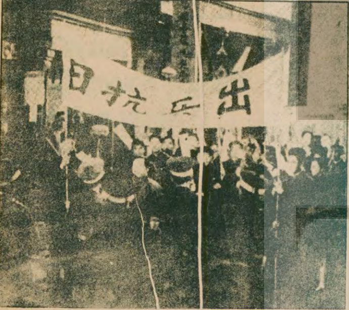
Çin Sinemasından bir örnek: Lao Ce'nin romanından uyarlanan "Hayatım" (1950).

MAURIN: Sorun yalnızca, bana göre, tek tek ya da grup ülkeler arasında olan bir şey değil, bütün bu ülkelerin her birinde seyircilerin filmi nasıl izledikleri, kullandıkları da farklıdır. Üçüncü Dünya ülkelerinde de bulunduğu genel duruma göre, Türk seyircileri kendilerini doğrudan ilgilendiren sorunlarla ilgilendirirken, bir Fransız seyircisi de kendisi için hiç de daha az önemli olmayan başka sorunlarla ilgilenebilir.