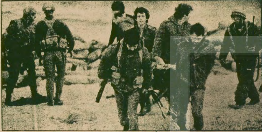
Filistin kamplarını basan Saldırgan İsrail komandoları.

"Washington Post" gazetesi, 18 Mayıs tarihli sayısında, Carter yönetiminin, Mısır-İsrail barışını koruma kuvvetlerine katılmak üzere, Orta Doğu'ya Amerikan birlikleri gönderilmesi olasılığını görüştüğünü bildirdi. Gazete, bu planın, bir barış gücü oluşturulmasıyla ilgili diğer tasarıların başarısızlığa uğraması halinde tek çözüm yolu olduğunu ve Amerikan yönetiminin bölgedeki BM kuvvetlerini görevde tutmak istediğini kaydetti. Bu arada Dışişleri Bakanlığının bir yetkilisi bu planın henüz faal olarak konuşulmadığını söyledi. Yetkililer, Carter'ın, önümüzdeki ay Brejnev'e yapacağı görüşme sırasında kendisine BM Barış Gücü kurulması yolundaki Amerikan önerisini desteklemesini isteyeceğini bildirdiler. Konunun temmuz ayında da BM Güvenlik Konseyine iletilmesi bekleniyor.