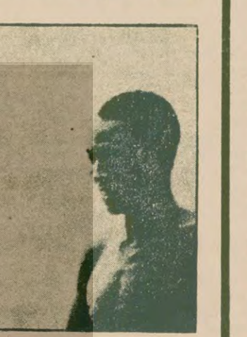
Afrika sinemasından Senegal'den kadın yönetmen Safi Faye'nin "Köyü Mektubu" (1973-74)

ROSSİ—Bugüne kadar gelişmiş olan sinema tek ve aynı sinemadır diye hatırlıyor. Biz hiç bir zaman sinemadan başka olasılıklardan sözlemiyoruz, bunların bir kısmı bizim