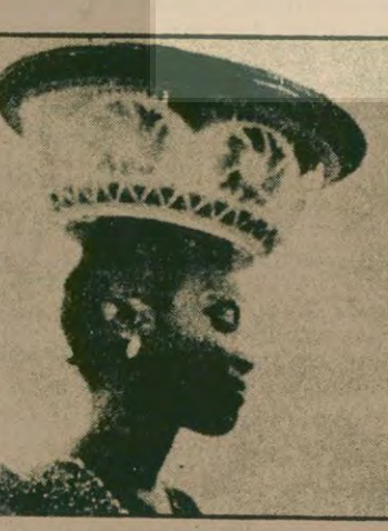
Afrika sinemasından Senegal'den kadın yönetmen Safi Faye'nin "Köyü Mektubu" (1973-74)

ROSSİ—Bugüne kadar gelişmiş olan sinema tek ve aynı sinemadır diye hatırlıyor. Biz hiç bir zaman sinemadan başka olasılıklardan sözlemiyoruz, bunların bir kısmı bizim