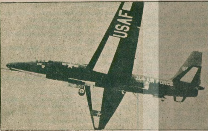
"Anlaşma denetleme aracı"

Hükümet ilke olarak U-2'yi kabul etmiş durumda, ABD'nin Rusya'dan getireceği "okey"i bekliyor