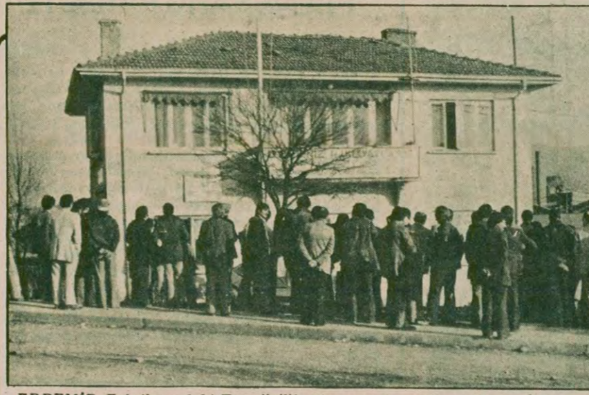
ERDEMİR Fabrikasındaki Temsilcilik binasının kapatılması Maden-İş'in son balonlarını da söndürdü.

"Çağdaş Devlet Malzeme Ofisi İşçileri Sendikası" adındaki sendika 13 Mayıs günü yaptığı Olağan Genel Kurulunda gündem gereğince, işkolundaki bir sendikaya katılma maddesini görüştü ve büyük bir çoğunlukla TGS'ye katılma kararı alındı.