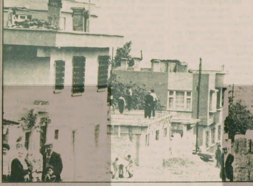
YÜRÜKSELİM MAHALLESİNDE TAMİRAT: Hayat yeniden başlıyor. Türkeş istemese de dünya yine dönüyor.

☒ "Fakiri fakire düşürdüler, ölen de fakir yatan da. Zenginlere bir şey olmadı."