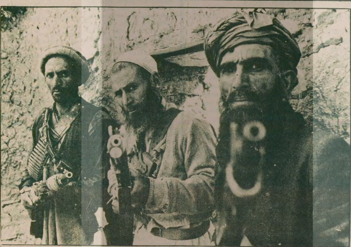
Afganistan'da başkent Kabil dışında bütün eyaletlerde müslüman gerillalar Taraki'ye bağlı birliklere karşı mücadeleyi sürdürüyor.