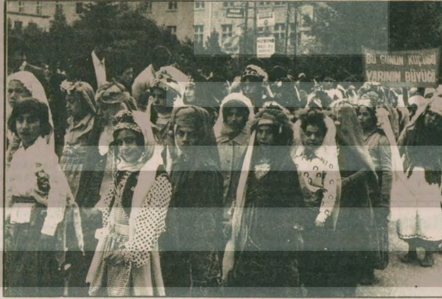
23 NİSAN TÖRENLERİNDEN BİR GÖRÜNTÜ: Alevi-Sünni çocuklar kol kola girmişler. Barış, huzur onların da talebi. Kiminin kardeşi ölmüş, kimi babasının acısını yüreğinde taşıyor.

☒ K. Maraş huzur içinde bir 23 Nisan geçirdi.