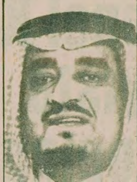
Suudi Arabistan Veliah'tı Prenes Fahd

Suudi Arabistan, Fransa'dan "Mirage" uçakları satın alabilir