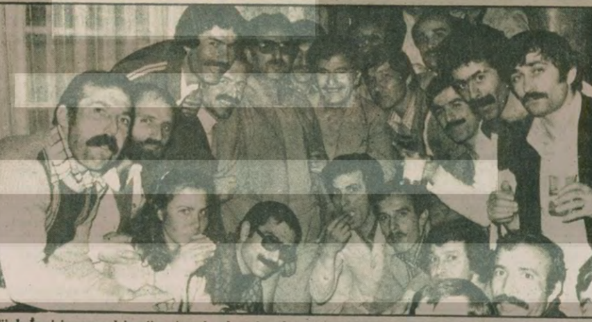
Türk-İş binasını bir süre işgal eden işçiler emellerini de neşe içinde omada yediler, ancak Denizciler'le görüşmeleri mümkün olmadı.