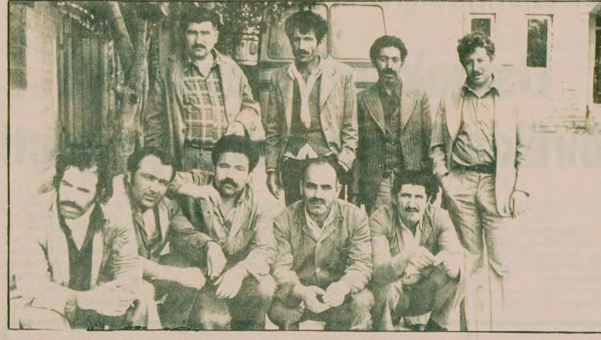
Maden-İş'in kölelik zinciri bir yerinden daha kırıldı!