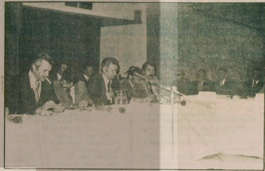
Sözleşme imza töreninden bir görüntü.