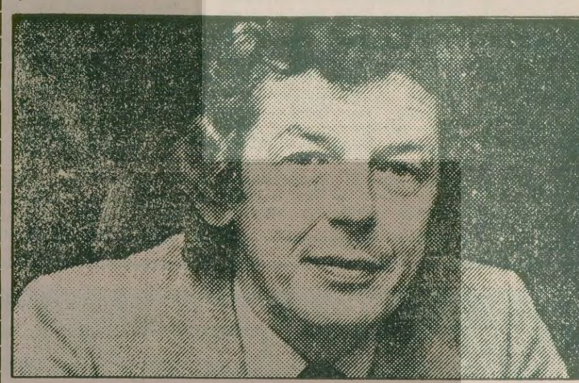
Hollanda Sendikalar Federasyonu Başkanı Wim Kok'un ASF Genel Başkanlığı için adaylığını koyması bekleniyor. Wim Kok aynı zamanda Sovyetler'de insan haklarını savunmak için kurulan "Olimpiyat Oyunları ve İnsan Hakları Komitesi"nin de üyesi.