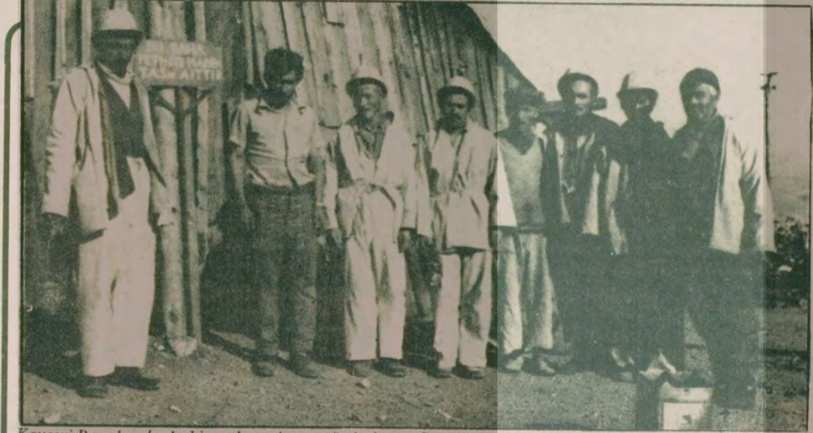
Kayseri Pınarbaşı'nda bir çok maden ocağı bulunur. Buralarda işçiler çok düşük ücretlerle ve her türlü sosyal haktan yoksun olarak çalışır. Üstteki fotoğrafta Karahanlı ocağında, aşağıda ise Pulpınar maden ocağında çalışan işçiler görülüyor.