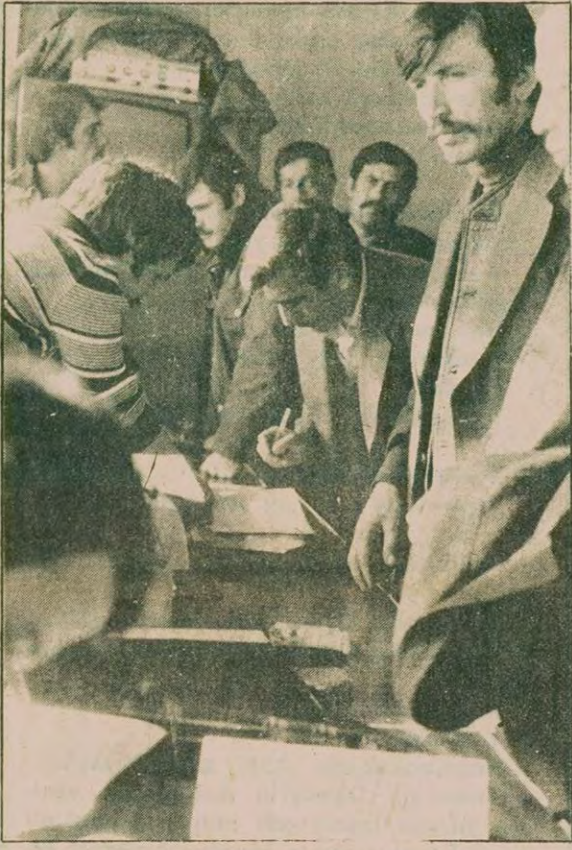
ERDEMİR işçileri TKP-İGD çetesine karşı mücadeleyi başarıyla sonuçlandırmaya hazırlanıyor.