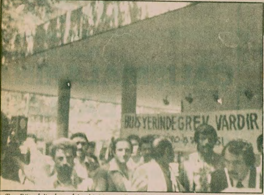
Tez Büro-İş'in İmar İskan'daki grevi örgütü, ve demokratik bir hava içinde sürüyor.