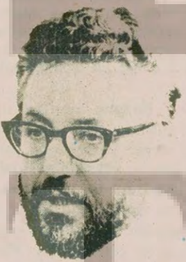
DR. İBRAHİM YAZDI