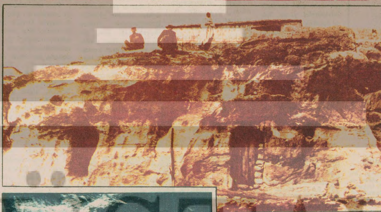
Kayalara oyulmuş oyuklarda insanlar yaşıyor. Yoldan sudan ve ışıktan mahrum olarak. Bütün bunlar yetmezmiş gibi 12 Mart döneminde bu köye gelen komandolar köylüye akalmaz eziyetler yapmış. Şimdi sikiyönetim ilan edilince köylüler "devlet bize sopa vurmazın. Yol yaparsın, su versin, bu sefîlik bitsin" diyorlar. "Bizden emin olsunlar, sınırlara bir tecavüz olursa ilk önce biz döğüşürüz" diyorlar.