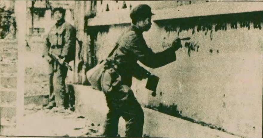
Çin'in mart ayında gerçekleştirdiği ihtar hareketi sırasında sınır birliklerine bağlı Çinli bir asker Vietnam'ın Langson kentinde Hanoi makamlarını uyandırıyor! "Eğer bize saldırırsanız, biz de saldırırız..."