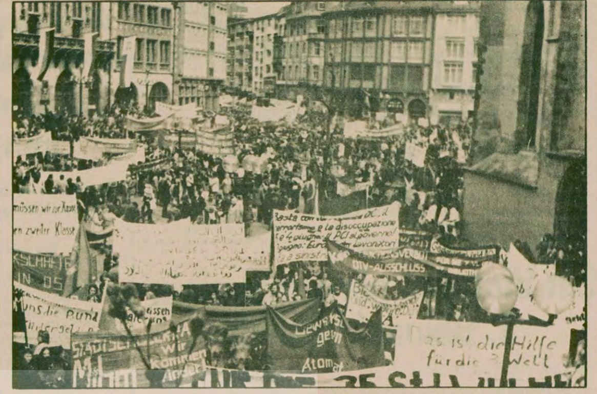
FRANKFURT'TA 1 MAYIS TÖRENİ...