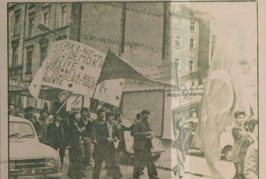
Frankfurt Halk Birliği 1 Mayıs Yürüyüşü sırasında görülüyor...