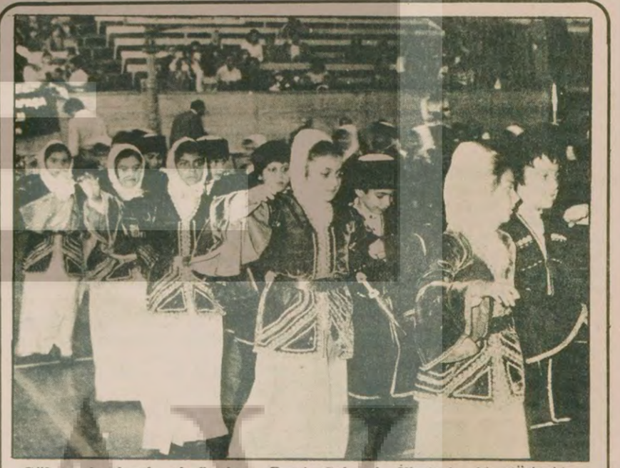
Şölene katılacak okullardan, Fezi Çakmak İlkokulu bir gösteride.