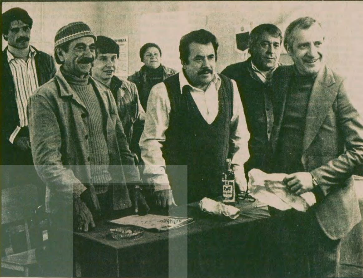
"Kuyruklu Piyanonun" filminden bir görüntü