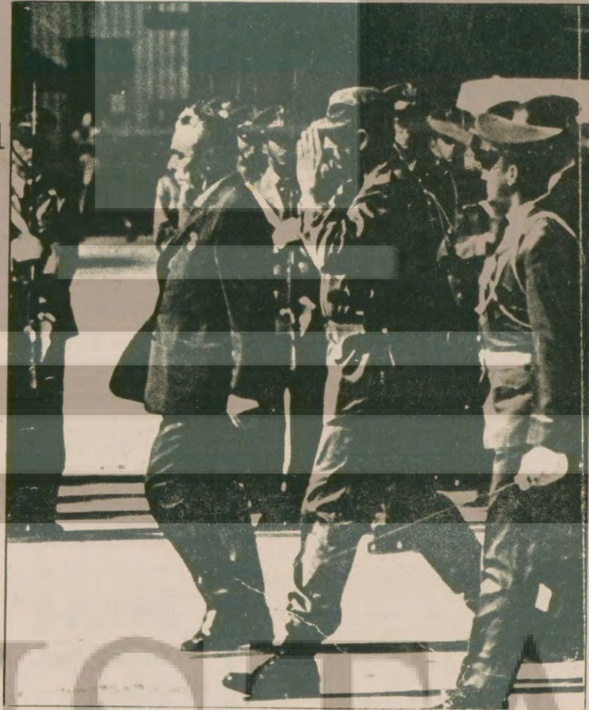
Fidel Castro: Brejnev'in emir eri

Sovyetler, 1976'dan itibaren Afrika'ya ortadan ikiye bölmek için giriştiği eylemler, Kübalılarla birlikte Angola'ya saldırdı. Daha sonra doğuya kayarak Afrika Boynuzuna yayıldı. Kübalılar, bu sırada, Ogaden ve