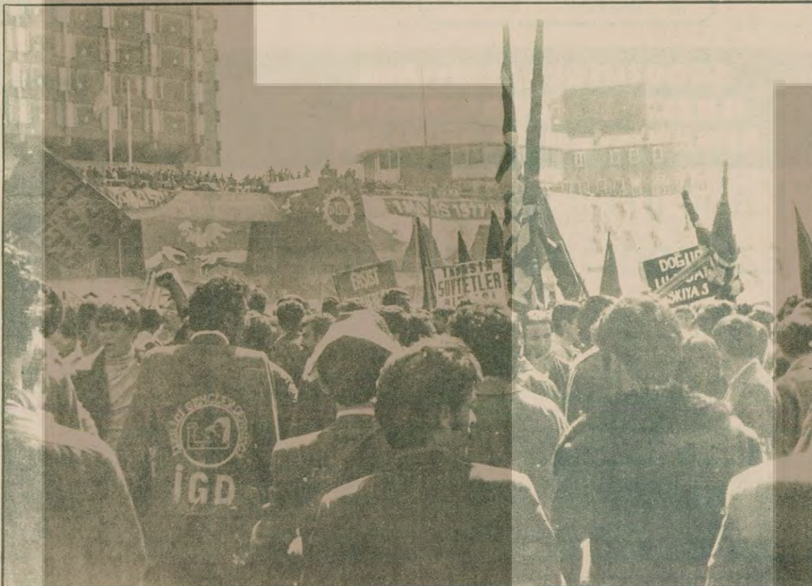
Türkiye İşçi Sınıfı 1 Mayıs'ı kutlayacaktır. Ama "Yaşasın Sovyetler Birliği" pankartları altında değil. İGD'li zorbalara sopa tehdidi altında değil.

lere birinci yıl için 135, ikinci yıl için 150 TL ücret zammı ve asgari ücret farkı verildi. Ayda 500'er lira yakacak, kira ve aile yardımı ve üç maaş ikramiye sağlandı. Sözleşmede kıdem tazminatının 55 gün üzerinden hesaplanması da hükme bağlandı.