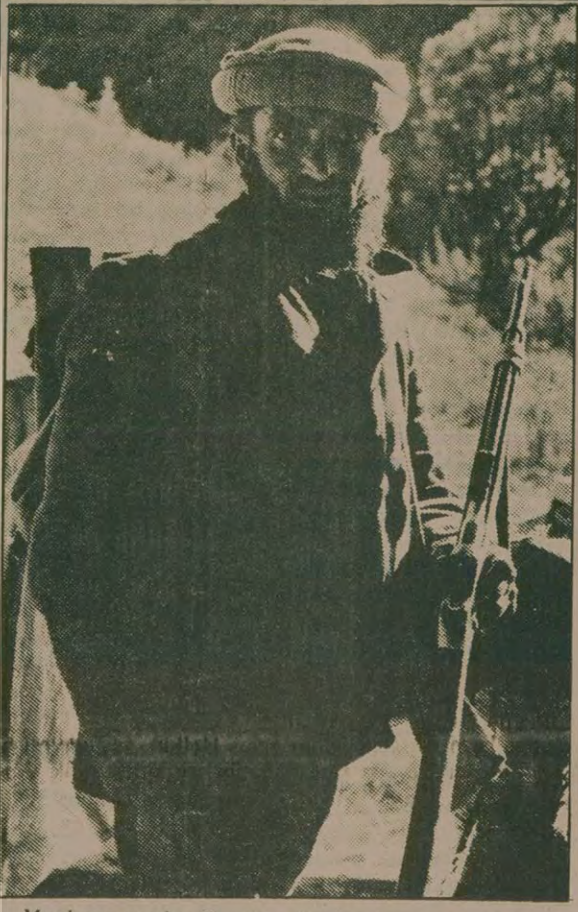
Moskova yanlısı Taraki rejimine karşı mücadele eden bir Afgan savaşçısı.

Taraki, Müslümanlara Afganistan'da kötü muamele yapıldığı yolunda Tahrir hükümetinin iddialarını yalanladı.