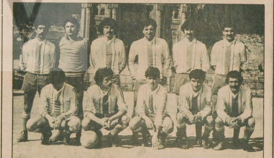
Altınay Spor Kulübü Futbol takımı

F. ALMANYA Amerika'nın Belmont Plaza Olimpiyat havuzunda yapılan F. Almanya-Amerika ikili yüzmeye yarışında Amerika birinci oldu ama F. Almanyalı genç ise öğrencisi Gerald Mörken yaptığı dereceleri yarışmanın en başarılı yüzücüsü olarak ilgi topladı. Amerika'nın F. Almanya'yı 222-122 yendiği yarışmada Gerald Mörken 100 metre serbestte 1.03.34' lük gibi dünya rekoruna yakın bir derece elde etti. Mörken ikinci büyük başarısını 200 metre serbestte 2.20.11' lik bir derece yaparak elde etti. Ayrıca genç lise yüzücüsü Gerald Mörken bayrak yarışmasında çok başarılı bir yarış çıkararak takımının 3.50.30 ile birinci olmasını sağladı. Bu yarışmada 100 metrede elde ettiği 1.02.06'lık derece kendisine ait dünya rekorundan 0.80 salise daha iyi.