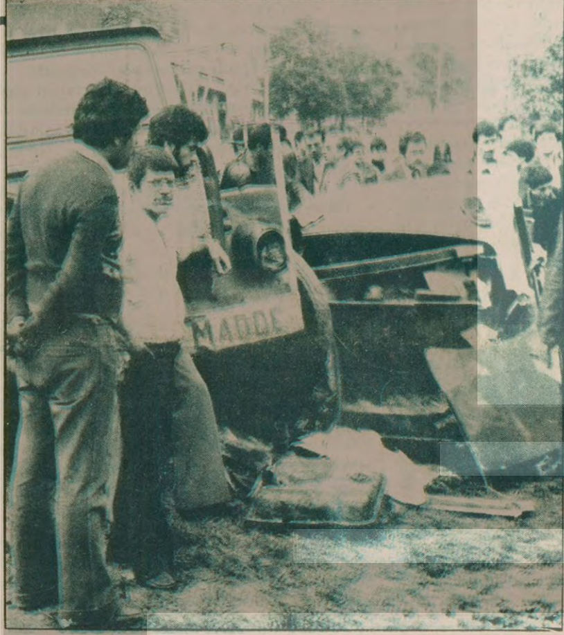
Besiktaslılara korkulu dalakalar yasağan tankler.