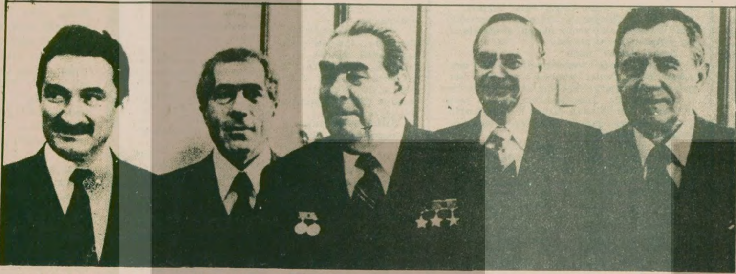
Ecevit Moskova'da siyasi belgeyi imzaladığı gezisi sırasında Brejnev'le yanyana: Hükümetin teslimiyetçiliğinin tepe noktası siyasi belgeyi imzalamak oldu.

Y AKINDA Türkiye'de bir hükümet değişikliği olacağından eminim. Ülke, hiç bir konuda siyaset formüle edemeyen bir hükümet ile daha fazla gidemez. Bu sözler içinde yaşadığımız günlerde söylenmiş değil. Bunları Ecevit, 2. MC hükümetinin yıkılmasından birkaç hafta önce, 1977 Aralık ayında New York Times muhbirine söylüyordu. Hatırlanacağı gibi o sıralar, 11'er olarak adlandırılacak olan milletvekili arıyordu. AP'den ayrılıyor, MC mecliste çoğunluğu kaybediyordu. Ve nihayet 1977'nin son günü MC, 218'e karşı 228 oyla düşürüldü ve kısa bir süre sonra Ecevit'in Başbakanlığına bugünkü hükümet kuruldu.