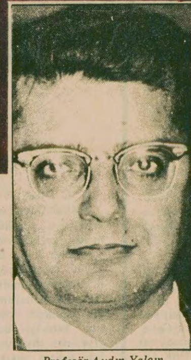
Profesör Aydın Yalçın

"Büyük devlet adamlığı, alışılmışın üstüne çıkabilen, ana hedefleri elde edebilmek"