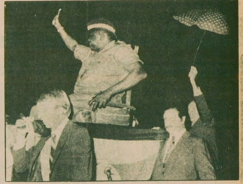
Bir zamanlar kendisini tahtta taşıyan Idi Amin Dada, şimdi kayıplara karıştı.