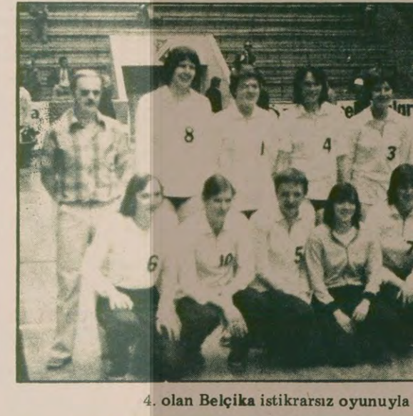
4. olan Belçika istikrarsız oyunuyla dikkati çekti.