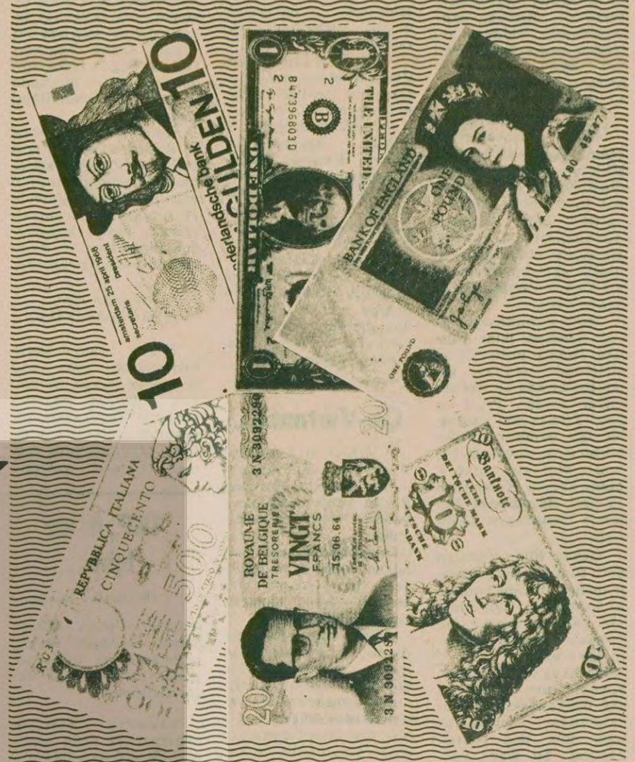
"Dövizle bağlılık 1948'de başladı ve bugün Türkiye ekonomisinin sembolü haline geldi."

Üçüncü çizgi yine hakim sınıflar içinde Batı ile uzlaşmaya karşı çıkan çizgi. Türkiye'nin içinde bulunduğu darboğazda çözümsüzlüğü hakim kılmak isteyen çizgi. Bu siyaset Sovyet sosyal-emperyalizminin yolunu açmak, onun arabasına Türkiye'yi bağlamak hedefiyle hareket ediyor. Çözumsuzlük ve kargaşalık yaratma peşinde koşuyor. Bunun savunucuları bugün için CHP içinde ama CHP'li olmayanlar. Bunlar bir avuç ama ilerici maskesi taktıkları için peslerinden iyiniyetli,