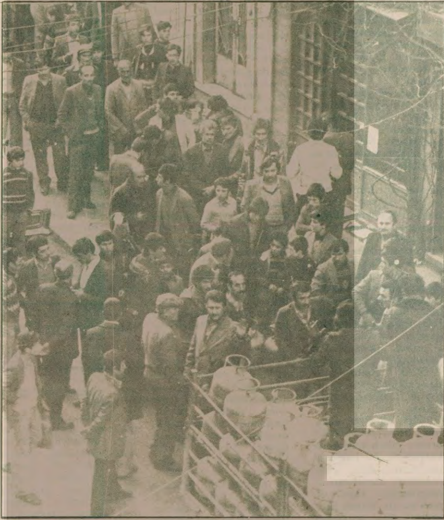
"Ekonomi kansızlık hastalığına tutulmuş gibi. Otomobiller benzin kuyruğunda, gaz yok, tüp gaz yok..."

di hayatına döviz girmeye başladı. O tarihten itibaren Amerikan emperyalistleri Türkiye'ye dövizle dayalı bir ekonomik modeli kabul ettiriyorlar. Karayolları zinciri ve otomobilcilik, sürekli petrol enerjisi kullanımı bu siyasetin ürünü olarak ortaya çıkıyor. Türkiye ekonomisi 1946'dan itibaren bu durumla dövizle bağlanıyor. Türkiye'de olmayan kilit kaynaklara dayalı bir üretim ve tüketim yapısı oluşuyor. Şimdi bugün Amerikan emperyalizminin yarattığı dövizle bağlı ekonomi