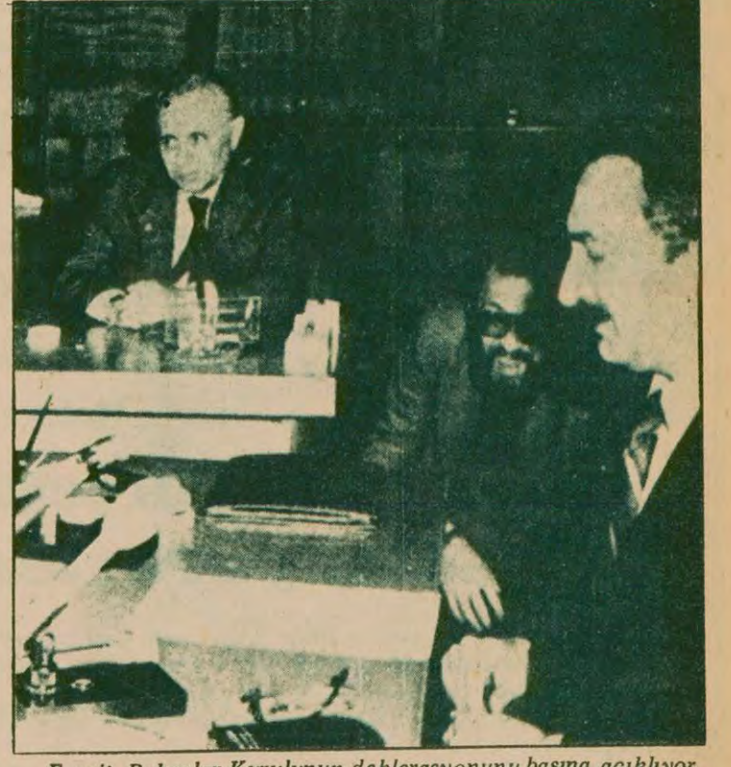
Ecevit, Bakanlar Kurulunun deklarasyonunu basına açıklıyor.