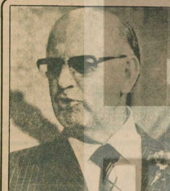
İrkçı Pretoria rejimiyle ABD arasındaki gerginlik artıyor

Batılı ajansların bildirdiğine göre, Talegani'nin kaçırılan iki oğlu daha önce Mücahitler tarafından esir alınmış, bir Homeyni Komitesi üyesiyle değiştirilmek suretiyle serbest bırakılmıştı.