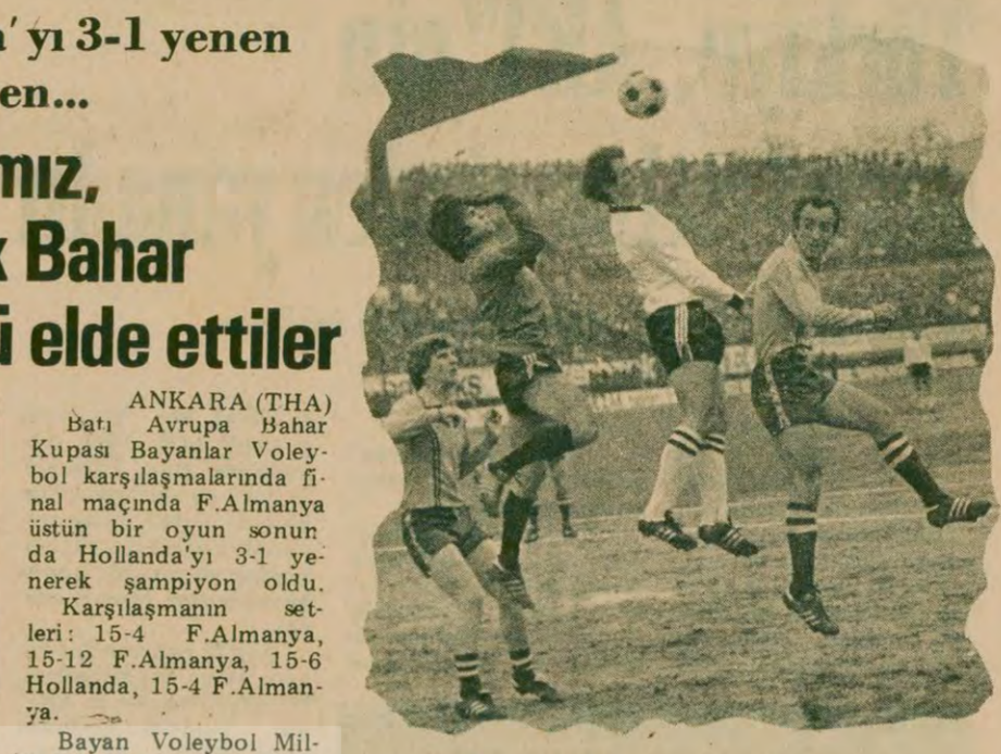
Trabzon-Beşiktaş maçından bir görünüş.

"Kuşkusuz programlı bir çalışma yapamıyoruz. Fizik Kimya derslerinin yapılabilmesi için nasıl laboratuvar gerekiyorsa beden eğitimi derslerinin yapılabilmesi için de tesislerin olması gerekiyor. Ancak bu güne kadar bu konuya sağlıklı bir şekilde eğilinmemiş. Beden eğitimi sürekli olarak önemsenmiş damgasını yemiştir. Bizler bunun zorluklarını konuşuk çalışmalarımızda aksaklıklar doğuyor. Bu da bence sağlıklı bir eğitim sisteminin olmamasından ileri geliyor. Ne öğrenciler ne de eğitimciler için rahat bir çalış-