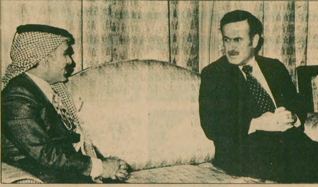
Kral Hüseyin, Orta Doğu'da barışçı bir çözüm olarak Cenevre konferansını önerirken, Suriye, Barış anlaşmasını başarısızlığa uğratmak için bir çağrı yaptı.