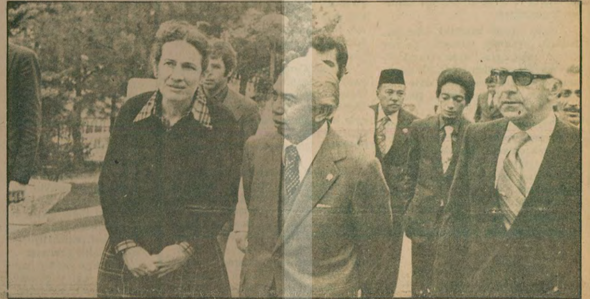
Yurdumuzu yaptığı resmi ziyareti tamamlayan Adam Malik bugün Bağdat'a hareket ediyor.

Endonezya Cumhurbaşkanı Yardımcısı Adam Malik: