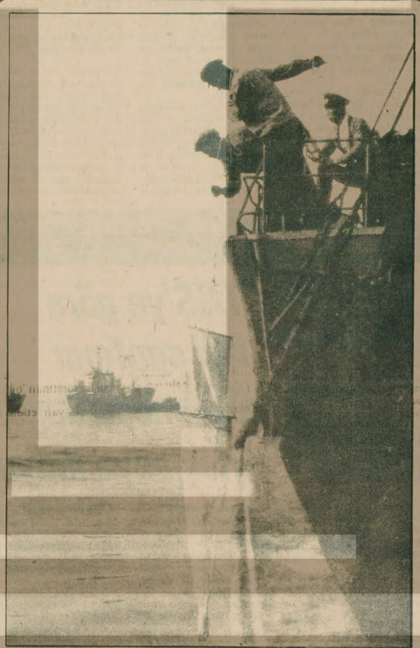
Milli ekonomiyi güçlendirmek için alınan önlemler