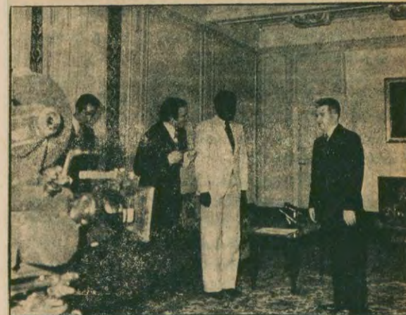
Romanya Devlet Başkanı Nikolai Çavuşesku Angola'dan önce ziyaret ettiği Gabon'da devlet televizyonunun sorularını cevaplıyor.

Rodezya'nın Mozambik'teki Zimbabve mülteci kamplarına karşı düzenlediği saldırılara katılan, dördü Rodezyalı, beşi Mozambikli dokuz paralı asker vatanı ihamet ve casusluk suçlarından yargılanarak idam edildi. İdam kararını veren mahkeme, daha önce de Rodezya saldırılarına katılan 10 kişiyi idama mahkum etmişti.