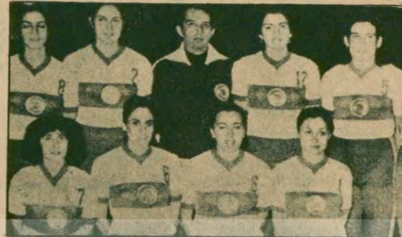
Bayan voleybolcularımız son yılların en önemli başarılarından birini aldı.