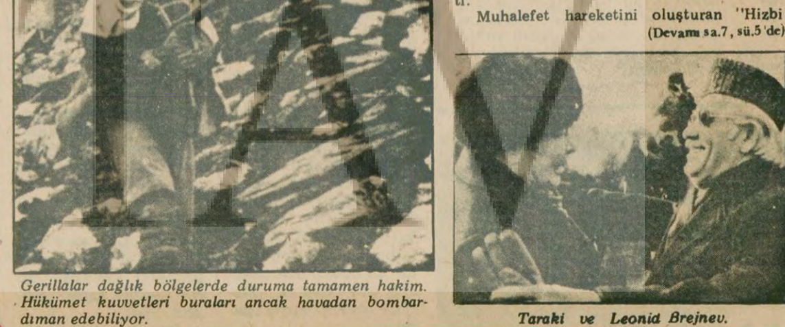
Taraki ve Leonid Brejnev.

DIŞ HABERLER SERVİSİ - Kanlı bir darbe ile Afganistan'da iktidarı ele geçiren Taraki rejimi, Müslüman gerillaların şiddetli direnişi karşısında, her geçen gün daha güç duruma düşüyor. Ülkenin üçüncü büyük kenti olan Herat ile Kabil arasındaki yolun gerillalar tarafından ele geçirilmesinden sonra, Taraki yönetimi bölgede yoğun bir hava bombardımanına girişti. Muhafefet hareketini oluşturan "Hizbi" (Devamı sa.7, sü.5'de)