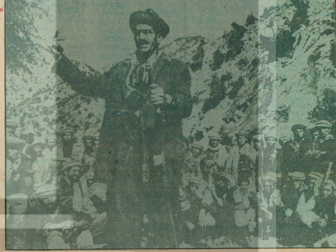
27 Nisan kanlı darbesinden bu yana Taraki yönetimine karşı mücadele eden Müslüman gerillalar Afganistan'da Müslüman gerillaların mücadelesi güçleniyor

ANKARA (ÖZEL) - Dün bir basın toplantısı düzenleyen AP Genel Başkanı Süleyman Demirel, devalüasyonun para konusunda aldığı son kararın eleştirilerek bu kararın Türk parasının hancereceğini, bir avuç mülki kişiyi halkın sırtından milyonlar yurda vurunun (Devamı sa.7, sü.5'de)