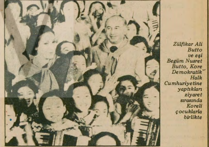
Zulfikar Ali Butto ve eşi Begüm Nusret Butto, Kore Demokratik Halk Cumhuriyetine yaptıkları ziyaret sırasında Koreli çocuklarla birlikte

● Adana, Diyarbakır, Akhisar ve Erzurum'da 5 kişi öldürüldü lamada gözaltına alınan 108 kişiden 17'sinin kadın olduğu belirtildi. İşgalin engellenmesinin ardından birkaç gün bölgeden çevreye sevk edilen askeri birliklerce yapılan geniş çaplı aramalar sırasında, 3'ü patlamaya hazır 12 adet dinamit lokumu, 18 adet (Devamı Sa. 7 Sü.1'de)