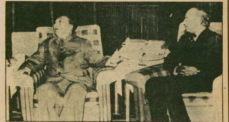
Butto, 1976'da Çin'i ziyareti sırasında Mao Zedung ile