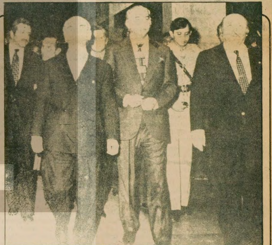
Zulfikar Ali Butto yurdumuzun değerli bir dostuydu. Resimde 22 Nisan 1976 günü RCD toplantısı için biraraya gelen Cumhurbaşkanı Fahri Korutürk, o günkü Başbakan Süleyman Demirel ve Butto görülüyor. (Devamı sa.7, sü.3'de)

HABER MERKEZİ Pakistan Eski Başbakanı Zulfikar Ali Butto'nun evvelki gün sabaha karşı saat ikide idam edildiği, Pakistan hükümeti tarafından açıklandı. Yapılan resmi açıklamaya göre Butto yerel saatle 1.45'de hücrelerinden alındı ve ceza saat ikide infaz edildi. Saat 4 sularında da askeri bir uçakla Sind eyaletindeki Sukkur havaalanına getirildi. Butto'nun cesedinin, havaalanında bekleyen bir helikopterle Naudero'ya nakledilerek burada defnedildiği bildirildi. Türkiye saatiiyle 8.30'da tamamlanan cenaze töreninde Butto'nun iki amcası ve yakınları bulundu. Butto'nun eşi Nusret Butto ve kızı, Ravalpindi'de gözetiminde buldukları için törene katılmadılar. Zulfikar Ali Butto'nun idamı nedeniyle Pakistan ordusunun alma ceğli ve Islamabad'da silahlı birliklerin devriye gezdiği bildirildi. Bilindiği gibi Zulfikar Ali Butto 5 Temmuz 1977'de General Ziya Ul Hak tarafından yapılan (Devamı sa.7, sü.4'de)