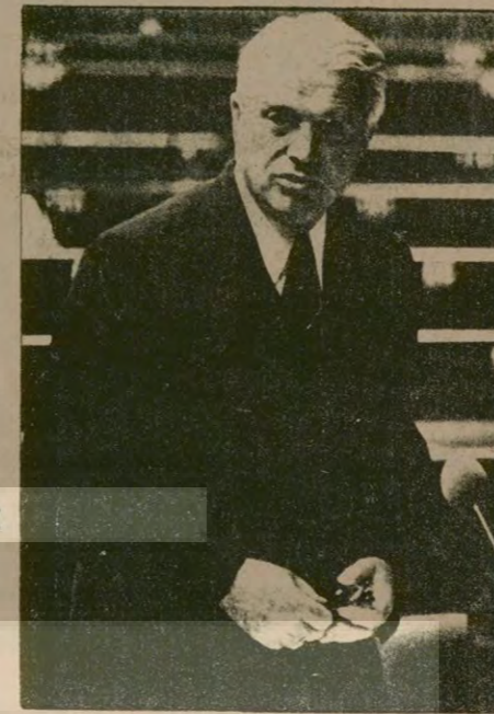
Emil Van Lennep