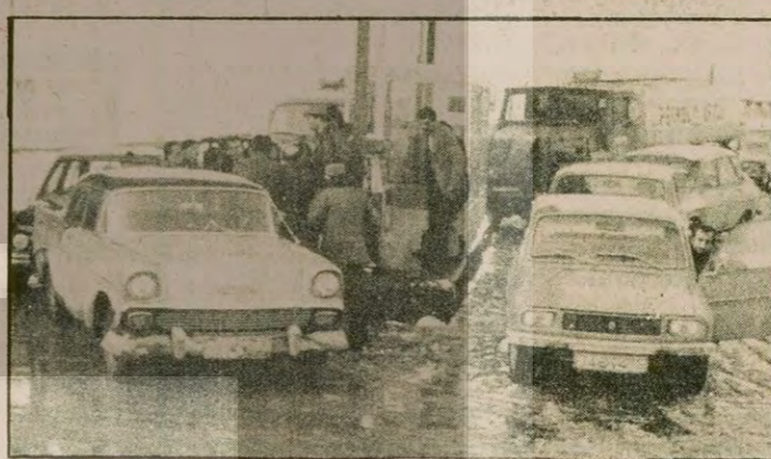
25 ŞUBAT 1979. BENZİN 9 LIRA... ARABALAR KUYURUKTA.