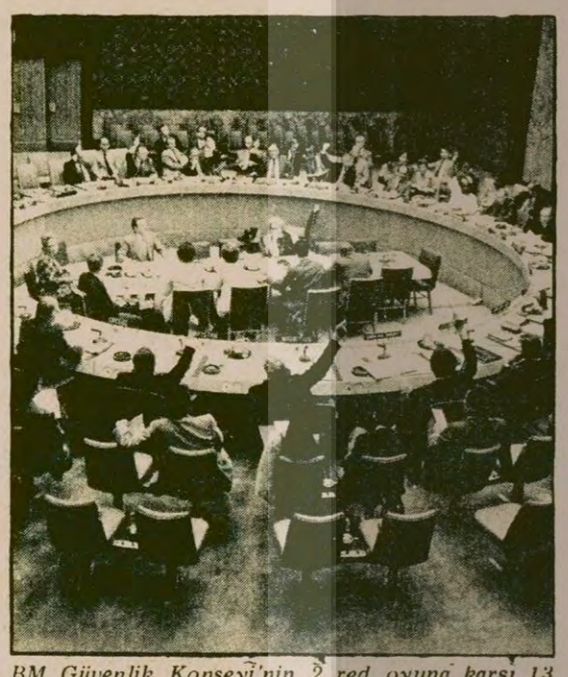
BM Güvenlik Konseyi'nin 2 red oyuna karşı 13 oyla kabul ettiği, Vietnam'ın Kamboçya'dan çekilme kararını Rusya veto etti.

NEW YORK (ÖZEL) Birleşmiş Milletler Güvenlik Konseyi'nin Vietnam'ın Kamboçya'dan çekilmesini öngören ikinci bir karar taslağını Rusya gene veto etti. Güney Doğu Asya Üjuları Orgütü ASEAN'ın 5 üyesi tarafından hazırlanan ve bu ülkelerden hiç birisi Güvenlik Konseyi üyesi olmadığı için Norveç aracılığıyla Konsey'e sunulan karar taslağı, Vietnam'ın Kamboçya'dan, Çin'i de Vietnam'dan çekilmesini öngörüyordu. Çin Halk Cumhuriyeti temsilcisi kararın lehinde oy kullandı. Güvenlik Konseyi'nin 15 üyesinden sadece Çekoslovakya, Rusya aynı yönde oy verdi. Çekoslovakya iki ay önceki oylamada da Rusya ile birlikte (Devamı sa.7, sü.9'da)