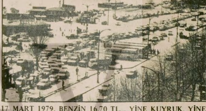
17 MART 1979. BENZİN 16.70 TL... YİNE KUYURUK, YİNE BENZİN YOK...