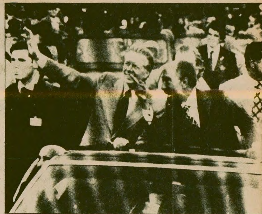
Carter ve Sedat, Kahire Havaalanından Kubbe Sarayına giderken

Öte yandan özellikle Bükreş'teki görüşmeler, Karamanlis'in Balkan gezisinin, bölge ülkeleri arasındaki birliği güçlendirmeye çalıştığını gösteriyor. Romanya'nın dış politikası, Balkan sorununu "nazik bir aşamaya geldiği" diye bir dönemde Karamanlis'in ziyaretlerinin son derece olumlu olduğunu kaydediyorlar.