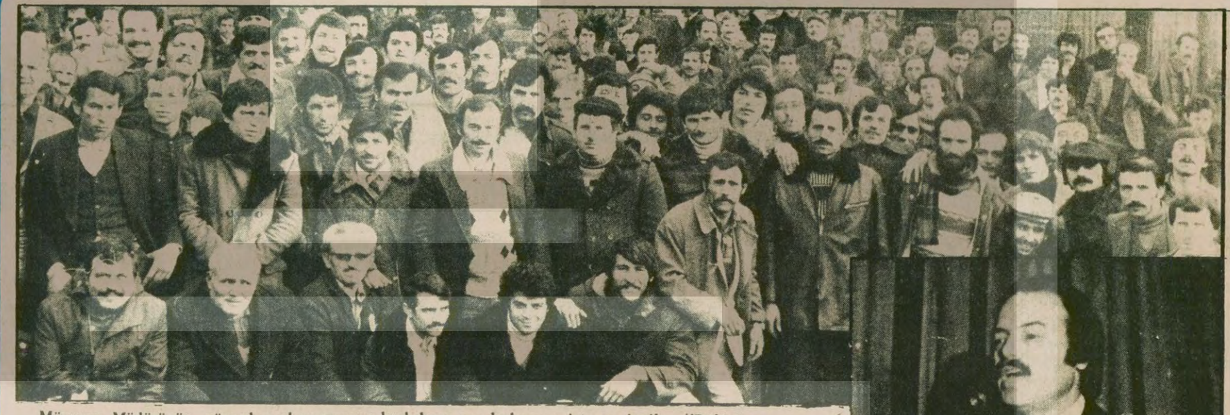
Müessese Müdürünün, görevden alınmasını ve baskıların son bulmasını isteyen işçiler, "Bölücü ve sömürücüler mi yaman, biz mi yamanız göreceğiz" dediler.