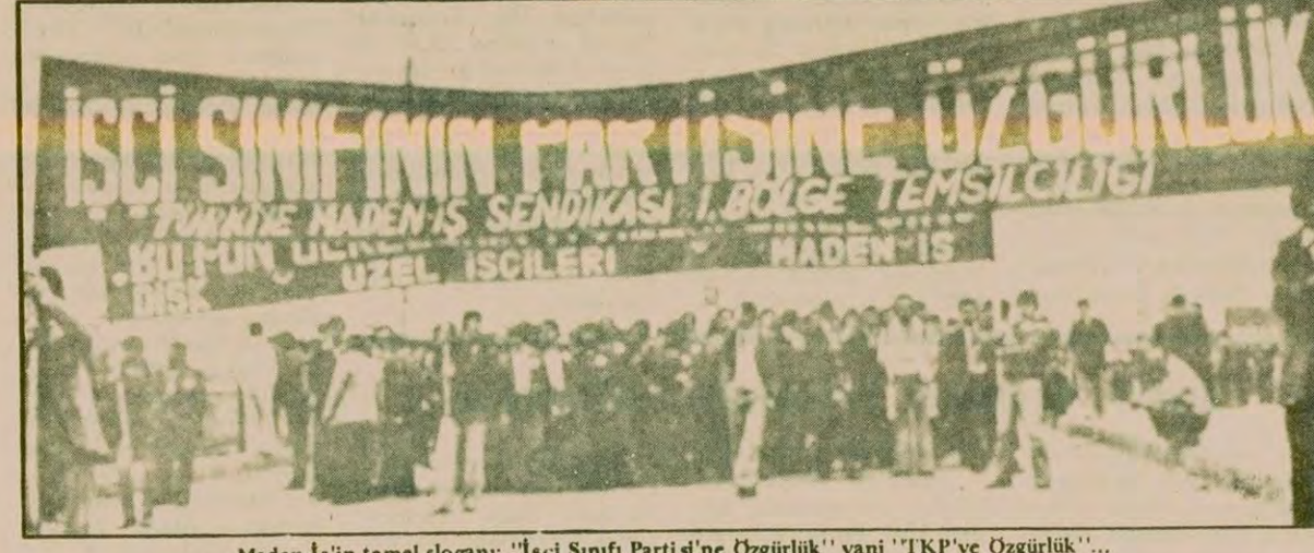
Maden-İş'in temel sloganı: "İşçi Sınıfı Partisi'ne Özgürlük" yani "TKP'ye Özgürlük"...