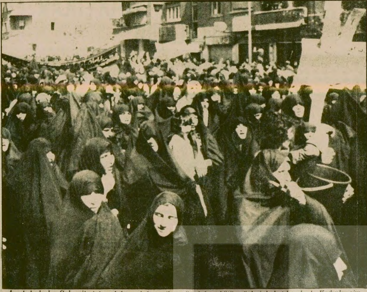
İranlı kadınlar Şah rejiminin yıkılması için verilen mücadeleye bütün güçleriyle katılmışlardı. Kadınlar şimdiki demokratik talepleri uğruna şeriat hanunlarına karşı gösteriler düzenliyor.