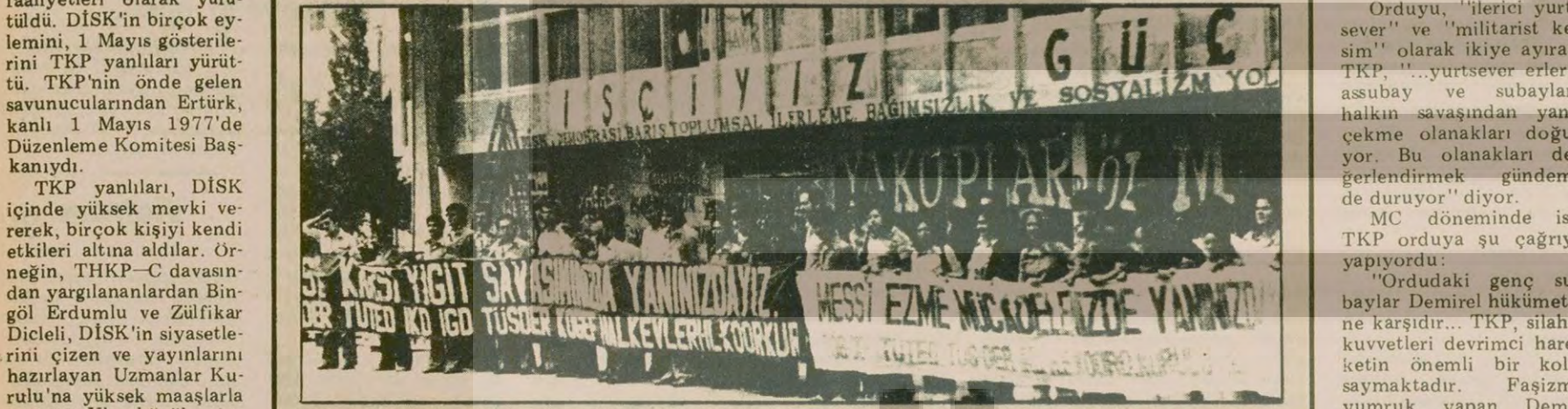
TKP çizgisinde derneklerle, yönetiminde TKP'nin etkili olduğu dernekler MESS grevi sırasında kocaman bir pankartla "Dayanışma"ya gelmiş; TKP yanlıları grevi satmakla Rafimayp 62 milyon liranın da üstüne oturduklar...

Maden-İş'in işçilere ödediğini söylediği para...: 165 000 000 TL Gerçekte ödenen para...: 102 331 318 TL Maden-İş'in vurgunu...: 62 668 682 TL