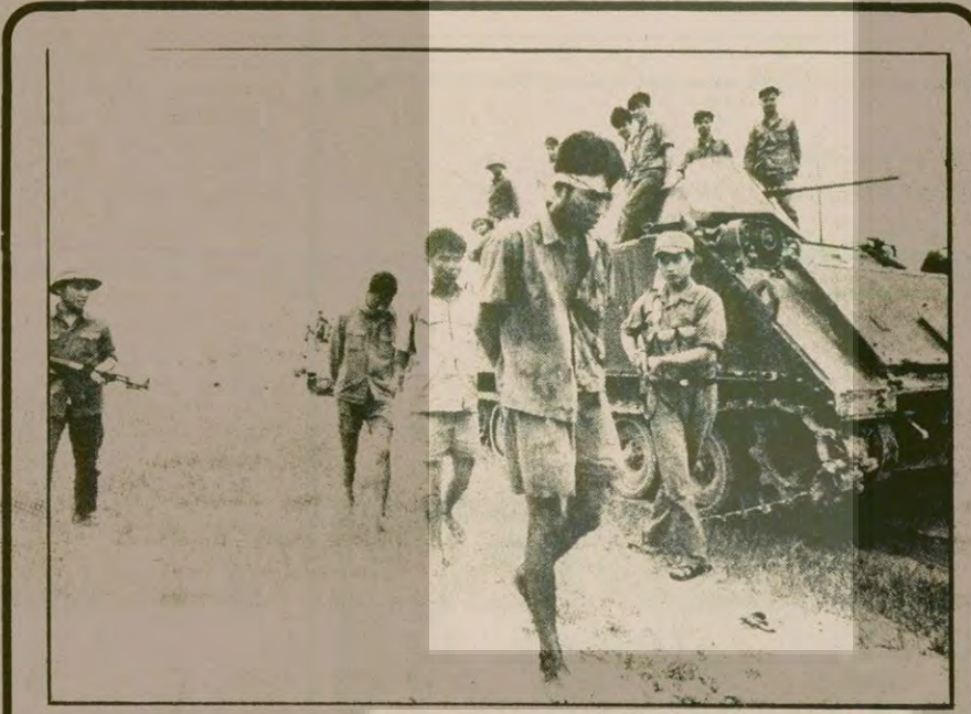
Vietnamlı işgalci birliklerin ve Heng Samrin'in Kamboçya halkına zulmettikleri yelmeyormuş gibi şimdi de Tayland'a saldırımları geniş tepkilere yol açtı. Resimde, Vietnam tankları eşliğindeki Heng Samrin birlikleri esir aldıkları Kamboçyalı köylüleri götürüyor.

ABD daha önce, Yemen olayları nedeniyle "Constellation" uçak gemisini Basra Körfezi'ne göndermişti.