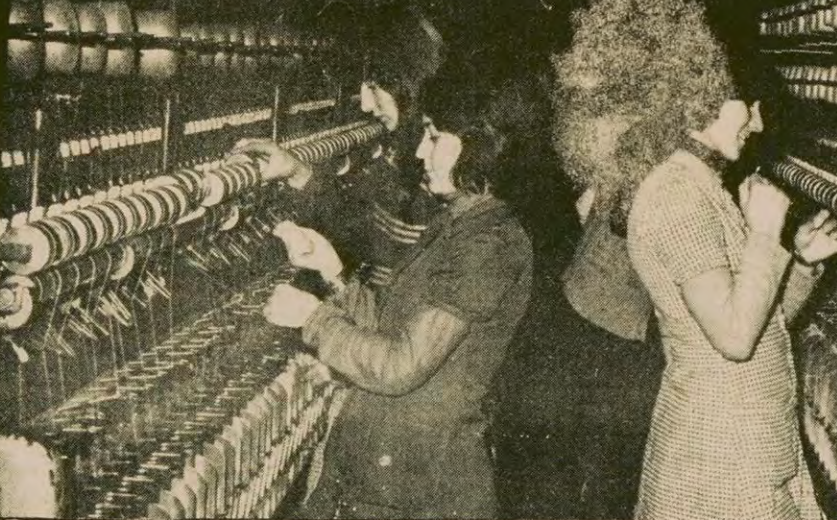
Eyüp Herko Tekstil Fabrikasında çalışan kadın işçiler. Onlar Türkiye'deki kadın işçilerin mücadeleciler karakterinin bugünkü temsilcilerinden. Bundan bir ay önce kadın işçilere baskı, in bir sefi, toplu mücadele ile fabrikadan uzaklaştırıldı. Baskı ve zulme tahammülleri yok. Sendikal mücadele içinde de aktif olarak yerlerini alıyorlar.

Kadınların kurtuluş mücadelesi bugün de sosyal kurtuluş ve bağımsızlık mücadelelerinin ayrılmaz bir parçası olarak bütün hızıyla sürmektedir.