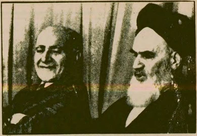
Homeyni, Bazergan Hükümetinin kurulduğundan bu yana Başbakanı ilk kez eleştirdi. Dini lider, Bazergan'ın Kuran kanunlarını değil, Batılı hukuk ilkelerini uygulamakla suçluyor.

Iran'da dini lider, hükümeti ilk kez eleştirdi