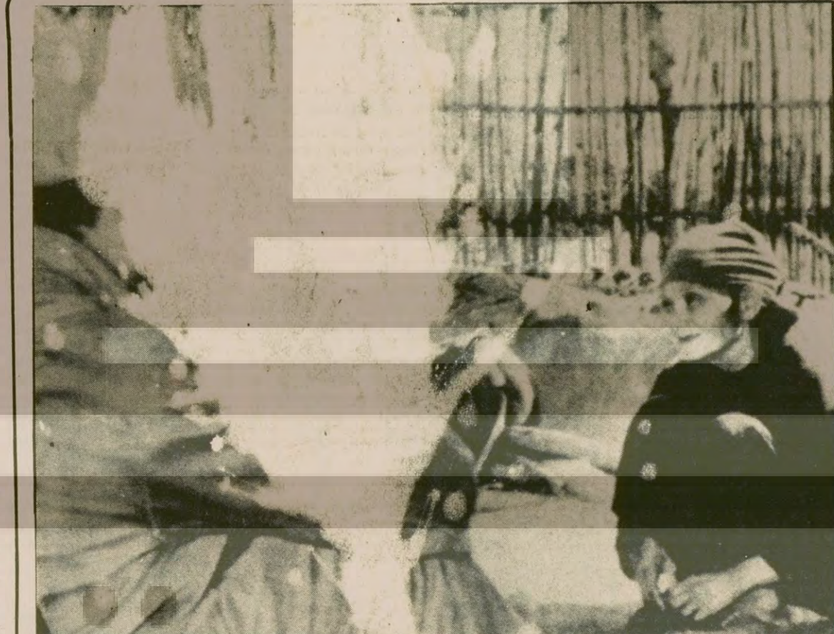
Guangxi sınır birlikleri ihtar hareketi sırasında yerli halka, askeri eylemin nedenlerini açıkladılar.

ECU sayesinde Batı Avrupa paraları özellikle sık sık kur değişen ABD doları karşısında eskiden olduğu kadar etkilenmeyecek.