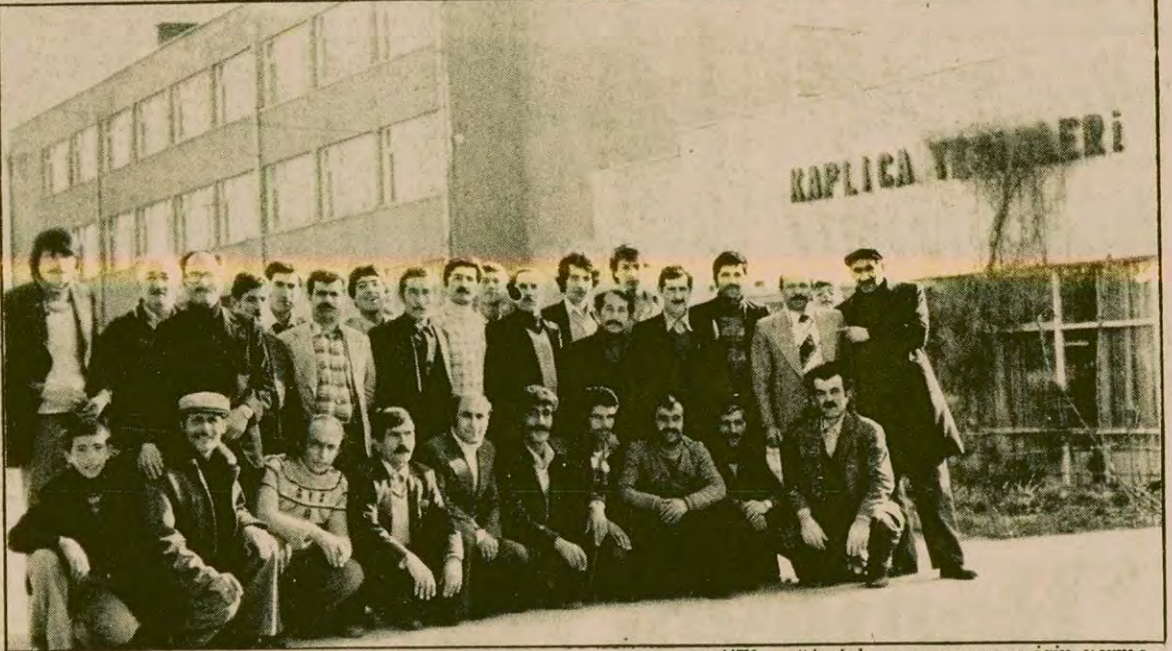
Haymana Belediye işçileri AP'li başkanın girişimlerini kınıyor ve "Ekmeğimize oynanmasına izin veremeyiz" diyorlar