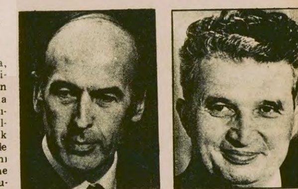
Fransa Devlet Başkanı Valery Giscard d'Estaing

Briksel'de bulunan NATO merkezi, konu ile ilgili bir bildiri yayımlayarak ajansın haberini doğruladı. Çeşitli kaynaklar, ka-