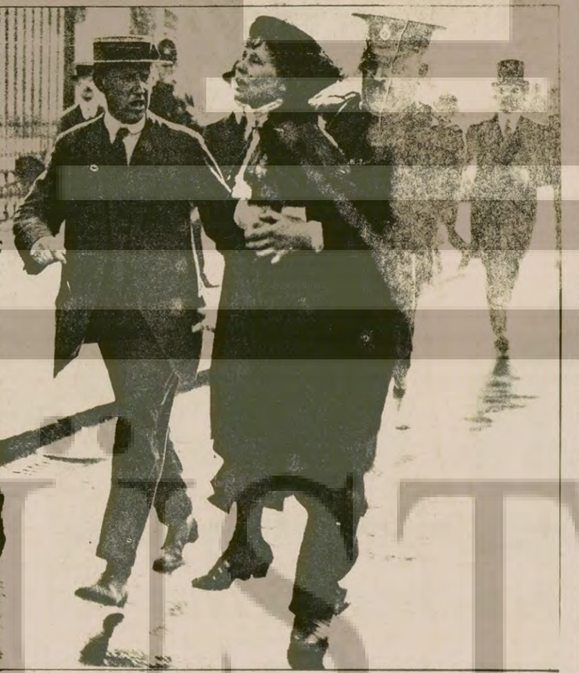
KADINLARA "EŞİT OY HAKKI" BÖYLE SAĞLANDI

Kadınların toplum içinde eşitlik kazanması kolay olmadı. Özünde sosyal kurtuluş mücadelesinin bir parçası olan bu mücadele gene kadınların kendi elleri üzerinde yükseldi.