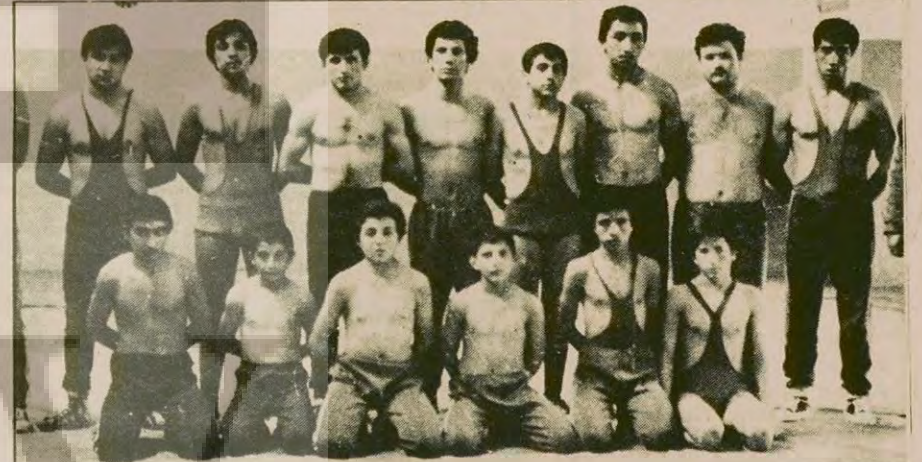
Güreşin gelişmesi için bazı bölgeler genç ve minik güreşçilere daha fazla ağırlık vermeye başladı.

ANKARA (THA) Batı Almanya'daki Türkiyeli işçiler, "Türk Güreşini Kalkındırma Kampanyasını" başlattı. İşçilerin başlattığı kampanya ilgili ile karşılandı. Batı Almanya'da çalışan Türkiyeli işçiler bu konuda "Sayın Güreş Federasyonu Başkanı Zeki Avrahoğlu ve arkadaşlarımızın yardım kampanyası ile ilgili girişimi yürekle destekliyoruz. Bu konuda üzerimize ne düşüyorsun yapmaya hazırız. Bu ülkenin çocukları olarak gü-