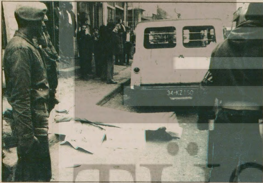
Fotoğrafta soyguncuların kurşunlarıyla ölen odacı Salih Dursun'un cesedi görülmektedir.

Son olarak AP Ortak Grup Toplantısına ve Bütçe oylamasına katılmayan Korkut'un istifası uzun süredir beklenmekte idi. Bazı AP'liler ise Korkut için "O zaten (Devamı sa.7, sü.3'de)