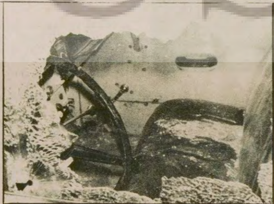
Ambulansın bütün camları paramparçadır. İçinde akan kan ve kurşun izleri görülmektedir.

ZAFER BAŞAR İstanbul Cerrahpaşa Hastanesi civarında dün sabah saat 10:30'da meydana gelen olayda, Hastaneyeye para götüren ambulans ve polis otosu tarandı. 15 milyon 181 bin 704 lira çalındı, bir odacı öldürüldü. Gaspdedi. (Devamı sa.7, sü.4'de)