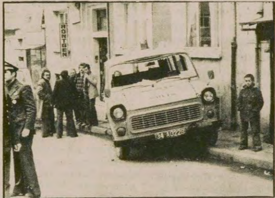
Soyguncularla, polis arasında çıkan çatışmada, bütün camları kırılan polis otosu görülmektedir.

ERZURUM (ÖZEL) Devrik İran Başbakanı Şahpur Bahtiyar'ın İğdir'da görüldüğü, sıkıyönetim makamlarına ihbar edildiği öğrenildi. Sıkıyönetim makamları (Devamı sa.7, sü.4'de)