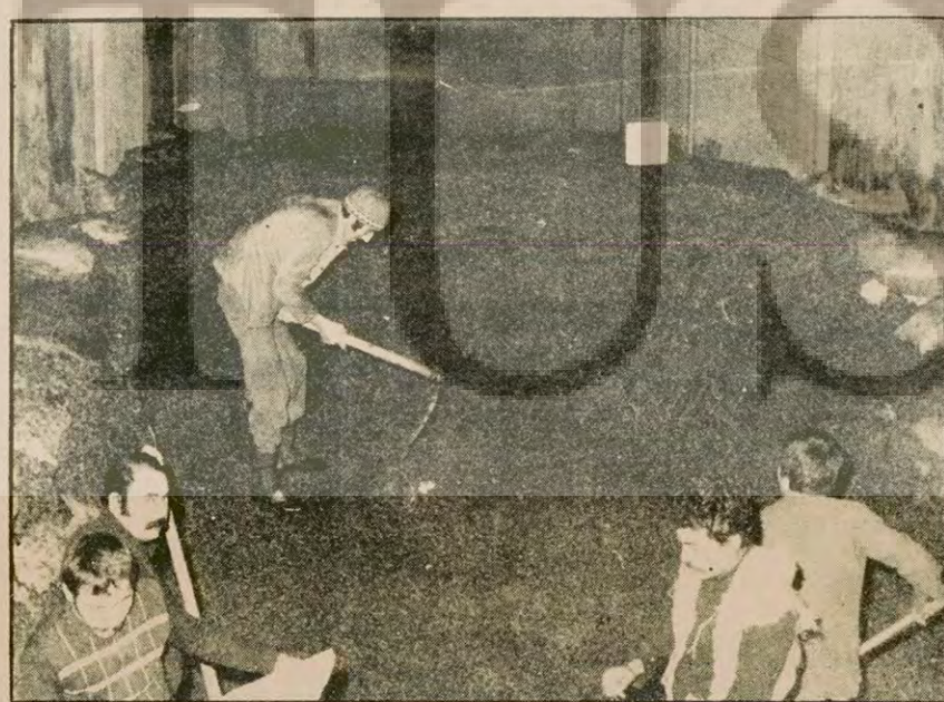
Güneydoğu Tarım Satış Kooperatifleri işyerlerinde çalışan yüzlerce işçi, yıllarca partizanlığı ve her türlü baskının çilesini çekti. Şimdi ise başından, sahte TKP belasını defnetmenin mücadelesini vermekte karşı karşıya bulunuyor.

İşçilere saldırılar, süngürlen, toplu işten çıkarılmalar AP'lisinden MSP'isine ve CHP'isine kadar herkesi hedef alır olmuştur. Bu arada MİSK'e bağlı Türk Gi-