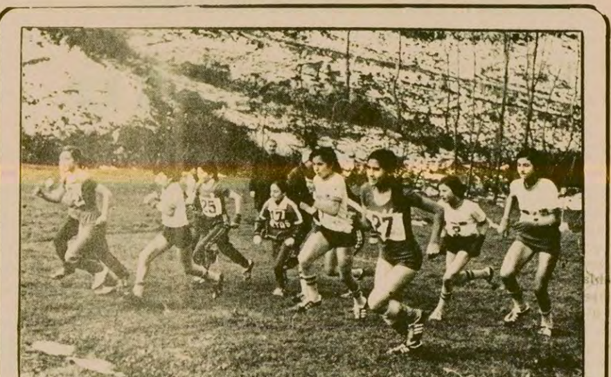
Bu yaşta kaldıramayacağı kapasitede vücuduna yük yüklenmesi ilerde birçok kalp rahatsızlıklarında temelini oluşturuyor.

Sovyet sporunda bu tür entrikalar pek olagan şeyler. Ancak uzun mesafe koşucusu Kutz, 1949 yılında ordulararası bir yarışmada devlet antrenörü Nikiforov tarafından keşfedilir. Bu sıralarda uzun mesafe koşularına Çek atletli Emil Zotopek egemen idi. Uzun ve sık antrenman modeli benimseniyordu. Nikiforov, Kutz'un, günde 40 km koşmasını istiyordu. Bu mesafeyi 30-40 tane 400 m, ve 10-15 tane 2000 metrelerle böliyordu. Çoğunlukla da ayaklarda yürüyüş çizimleri ve sırtta kum torbaları ile.