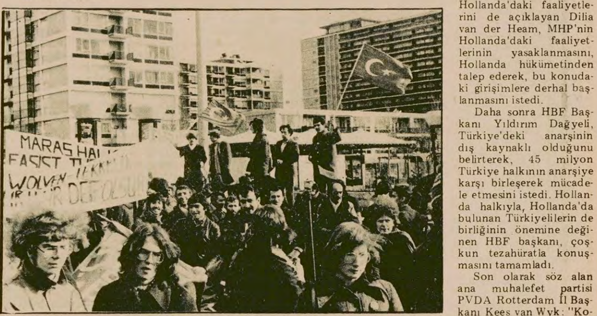
Yüzlerce Türkiye'li ve Hollandalı'nın katıldığı yürüyüşte MHP ve Kontrgerilladan hesap sorulması, MHP'li katillerin Hollanda'ya iltica hakkı verilmesi ve MHP'ilerin Hollanda'dan sınır dışı edilmesi istendi.