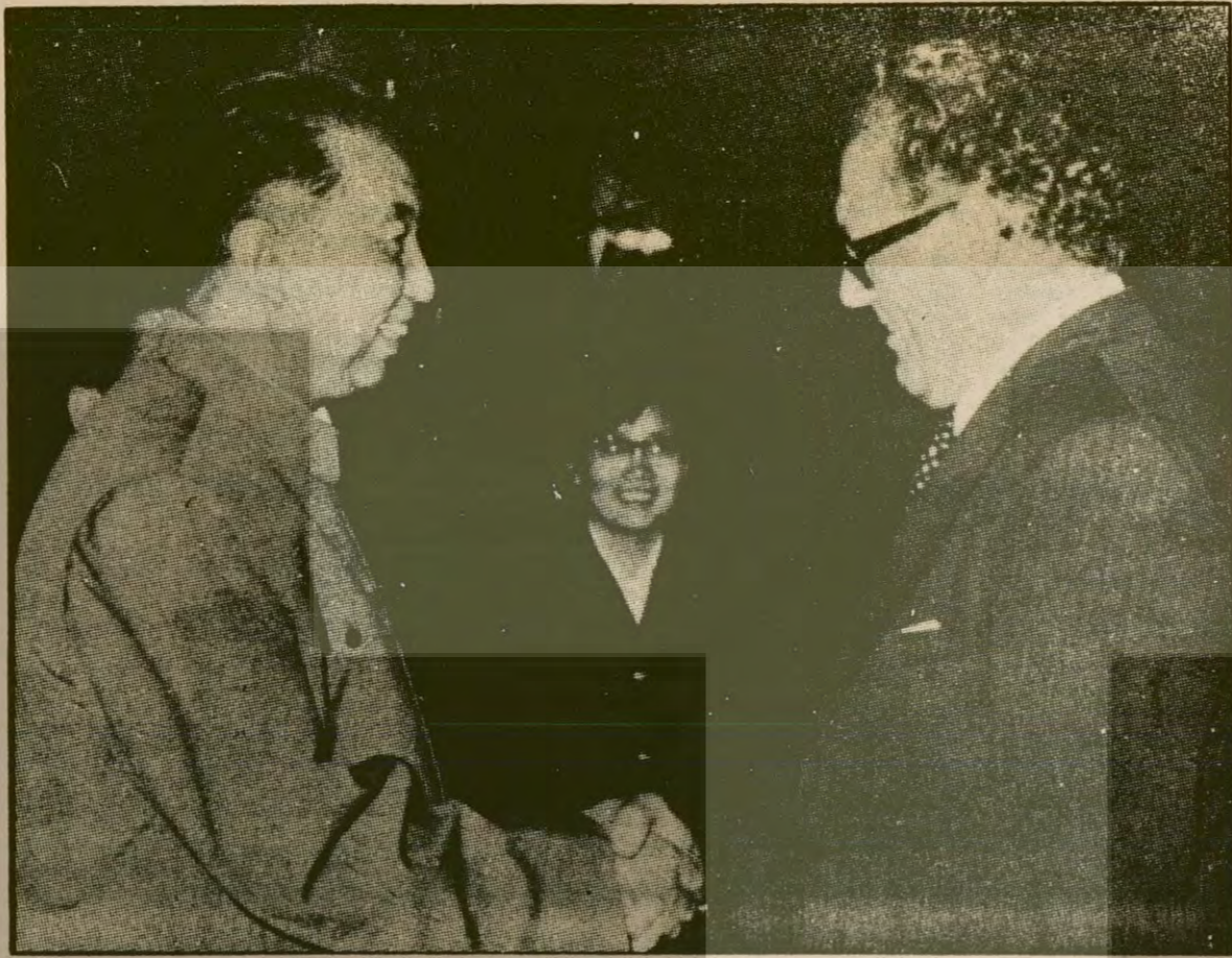
HUA KUO FENG VE HAFERKANP

Avrupa Ekonomik Topluluğu'nu yıllar boyunca "kapitalist bir topluluk" olmakla suçlayan Çin, 1964'ten başlayarak, Birleşik Amerika'nın Avrupa üzerindeki etkisini düzenlemeyi öngören De Gaulle siyaseti sonucu Fransa ile yakınlaşmış, AET'ye uluslararası diplomatik alanda ilgileye