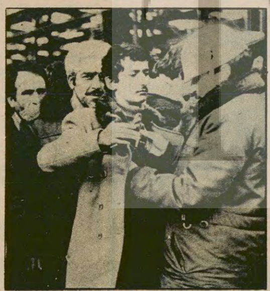
Çok sayıda polis ve askerle kuşatıldığı fabrikada dün işgale son veren işçiler, üzerleri arandıktan sonra kamyonlara bindirilerek gözaltına alındılar.