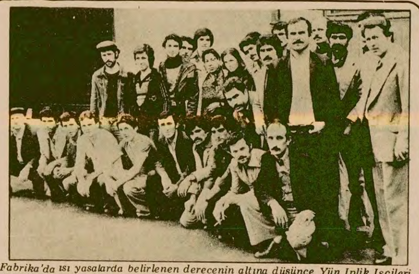
Fabrika'da ısı yasalarında belirlenen derecenin altına düşürme Yun İplik İşçileri işi bıraktı.

Devrimci Sağlık-İş Sendikası'ndan yapılan açıklamaya göre yemek yememe eylemi, İstanbul da Göztepe ve Eyüp SSK Hastanelerinde, Ankara'da Dışkapı Çocuk Bakım ve Adana SSK ve Karşıyaka SSK hastanelerinde, İzmir'de SSK Alsancak Hastanesiyle Edirne ve Antalya SSK hastanelerinde uygulandı.