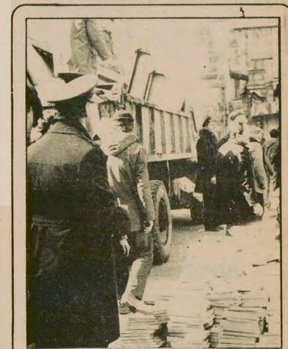
11 yıldan beri Taksim'de halkın yüzde 50'ye varan bir indirimle kitap satın alabildiği, "kitap sergileri" yok artık... 21 kitap sergisi dün, üç bir gerekçe gösterilmeden kaldırıldı.

● "Gençlik ve Spor Bakanlığı üst yönetimi, ülkenin spor sorunlarını çözmek yerine teknik adamları ve beden eğitimi öğretmenlerini harcamakla uğraşılıyor"