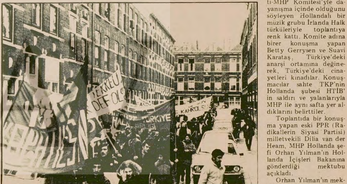
Anti MHP Komitesi tarafından düzenlenen yürüyüş ana muhalefet partisi PVDA, D'66, PSP, PPR gibi partiler ve Avrupa Türkiye Halk Birlikleri Federasyonu katıldı.