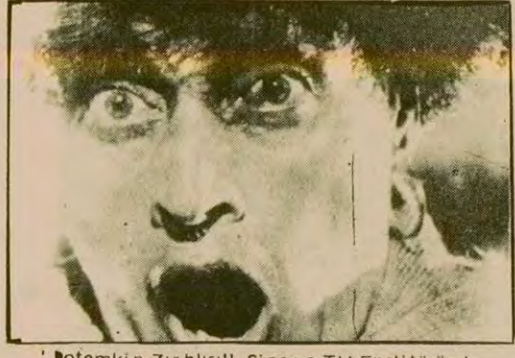
"Potemkin Zirhlisi". Sinema-TV Enstitüsünde.