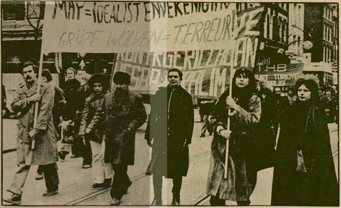
Hollanda'da 24 Şubat Cumartesi günü yapılan "MHP ve Kontrgerilladan Hesap Sorulmalı" yürüyüşüne yüzlerce kişi katıldı.

ODTÜ'den bu yıl 900 öğrenci mezun olurken, 2500 yeni öğrenci alındı. Üniversitede toplam öğrenci sayısı ise 12 bin 500.