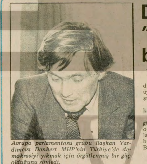
Avrupa parlamentosu grubu Başkanı Yardımcısı Dankert MHP'nin Türkiye'de demokrasiyi yıkmak için örgütlenmiş bir güç olduğunu söyledi.

DIŞ HABERLER SERVİSİ Bir süredir dikkatleri üzerinde toplanan İran'daki Sovyet yanlısı Talabani'nin ayaklanma hareketinin durduğu açıklanırken, doğu komşumuzdaki gelişmelere yenileri ekleniyor. Şah'ın İran yurttaşlarından çıkarıldığı, yegnenlerinden birinin daha ülkeden kaçarken yakalandığı, bir süre duran yurtdışı uçak seferlerinin Pazartesi'den itibaren başlayacağı haber veriliyor. GENİŞ HABERİ 3. SAYFADA