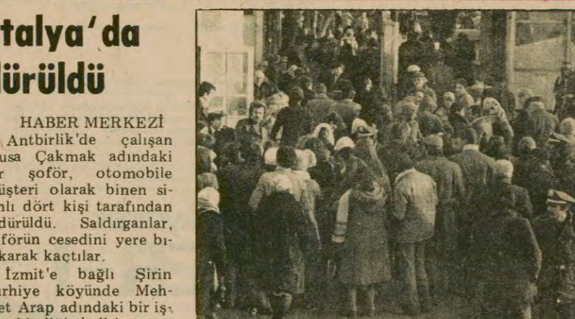
Dün İztiköy vapur iskelesinde polis, bütün gün arama yaptı.

• Adana'da açılan ateş sonucu iki kardeş ağır yaralandı • Konya'da bir eve atılan bomba sonucunda bir öğrenci ağır yaralandı