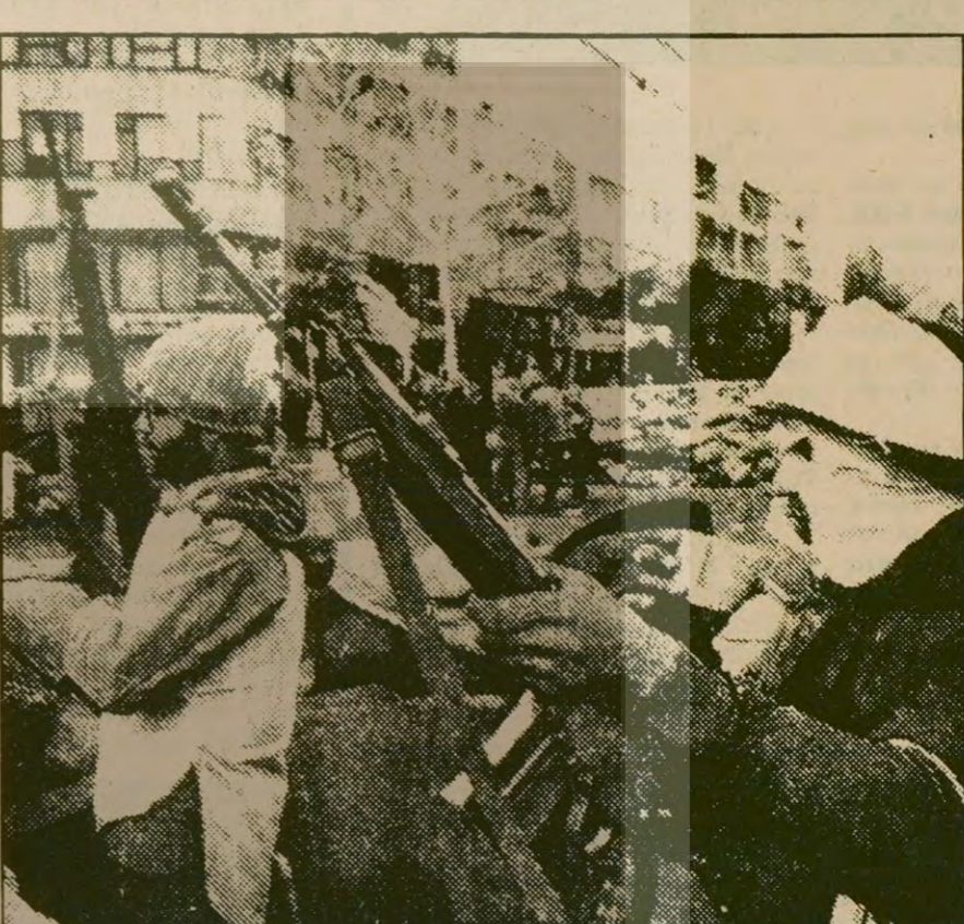
Moskova'daki "Halkın Savaşçı Öncüleri" grubu, önceki gün Tahran'da bir gösteri yaptı. Göstericiler, toplantı boyunca Homeyni'yi suçladılar.

Kore Demokratik Halk Cumhuriyetinde yayınlanan "PYONGYANG TIMES": "Vietnam'ın komşularına karşı hakimiyet kavgası vermesi, ağır bir suçtur" • "Bu, sosyalizmi hiçe sayan ve barışı tehlikeye sokan, açık bir meydan okumadır" 3.Sayfada