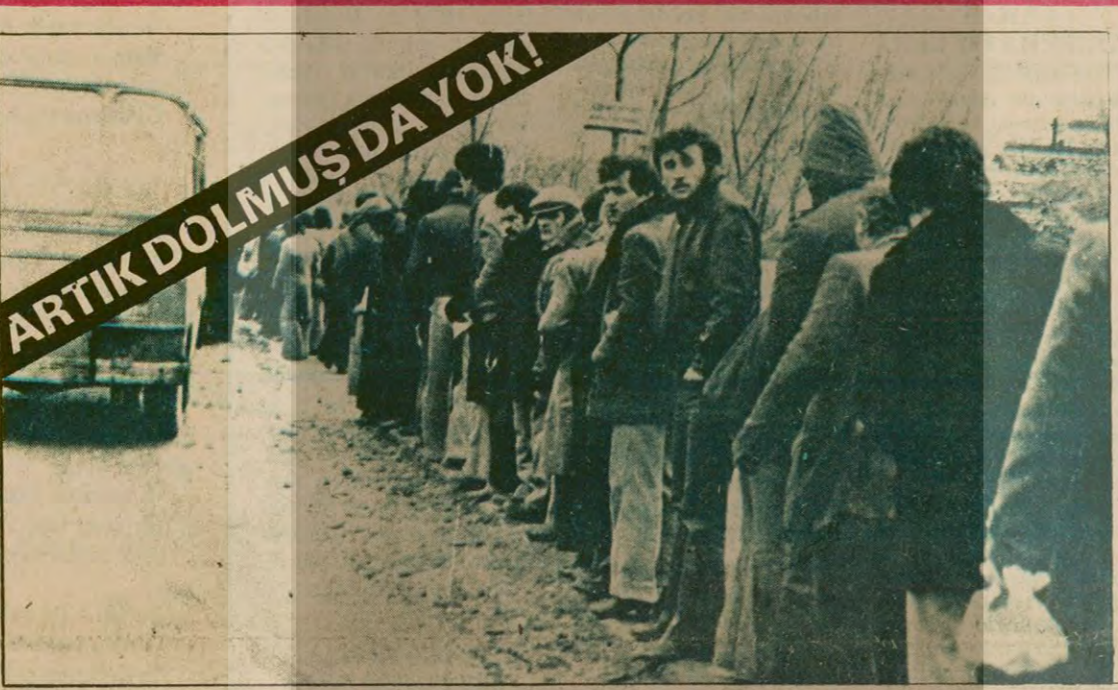
Istanbullular bir yerden bir yere gitmek için saatlerce duraklarda beklemek zorunda. Bu bekleyişin sonunda dolmuş bulamayıp, yürüyerek gitmek de var.