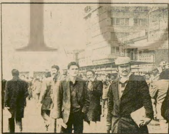
Aksaray'daki Belediye otobüsü darlığı. Günün her saatinde böyle kalabalık. Belediye otobüsü gelse bile otobüse binememek başlı başına bir beceri.

Belediye otobüslerinin yarısının arızalanıp sefer dışı kalmasından sonra, İstanbul'da şimdi dolmuş da bulunamıyor. Mazot yoksulluğundan had safhaya ulaşması, İstanbulluların evlerinden işlerine, işlerinden evlerine götüren dolmuşların çalışmalarını engelledi. Her gün şehir içinde yola çıkmak isteyen minibüsler dörtte biri çalışmıyor. İstanbullular işlerine en kolay şekilde yürüyerek gidip gelebiliyor.