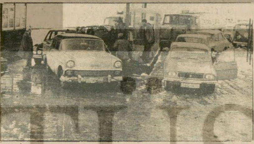
Dün İstanbul'da benzin de yoktu. Benzinciler önünde oluşan kuyruktrafiği uzun süre aksattı.