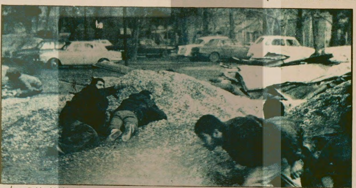
İran, Şah'ın birliklerine karşı dışişleri bir mücadele yürüttüğü günlerin hemen ardından, bu kez de kuzeydeki düşmanın güçleriyle karşı karşıya... Moskova yanlısı Talabani'nin kuvvetleri gerek Sovyet sınırındaki, gerekse Irak sınırındaki Kürtleri ayaklandırmaya, İran'ın birliğini çökertmeye çalışıyorlar...

Demirel, Korutürk'e gönderdiği mektupta, "Ordunun görev yapmasını hükümetin engellediğini" ileri sürdü