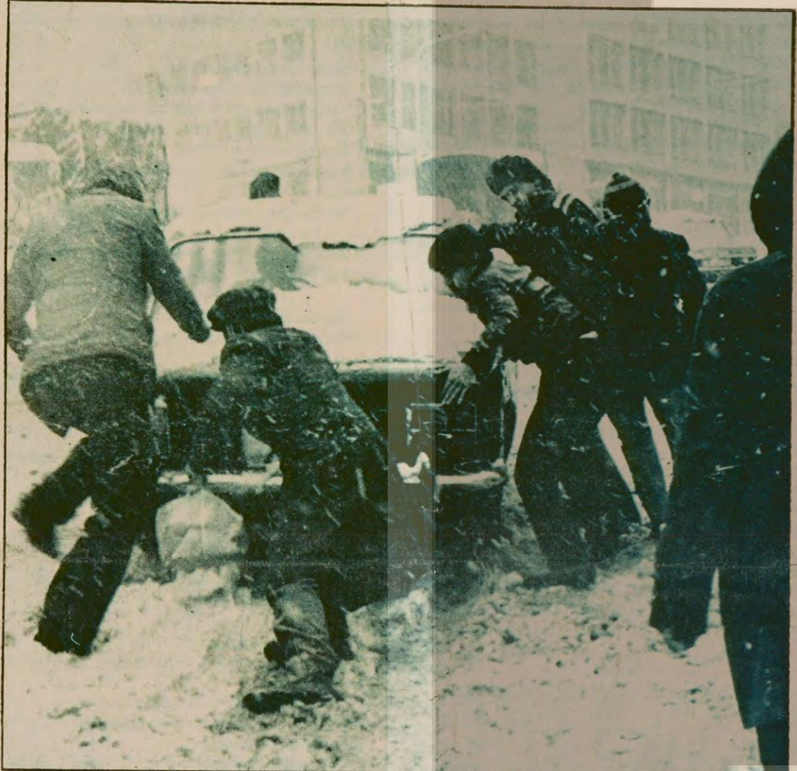
Dün İstanbul'da en sık görülen manzaralardan biri. Yolda kalan araba sürücülerinden bazıları kendi güçlerine güvenirken bazıları da para karşılığı vasıtalarını kurtarmak için adam tuttular.