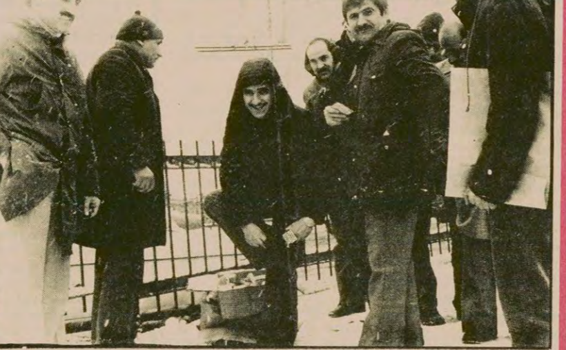
Ver On kağıdı, kurtar paçayı. Dün İstanbul'un çeşitli köselerinde görülen manzaralardan birisi de kaymayı önlemek için yayalara satılan aletti. On lirayı veren ayağına patına zinciri takarak düşmekten kurtuldu.

HABER MERKEZİ Ve İstanbul'da hayat durdu... Önceki gün başlayan kar yığışı dün sabahтан itibaren aralıksız olarak devam edince İstanbul'da hayat durdu. Vapurlar çalışmadı, trenler çalışmadı, uçak seferleri aksadı otobüs ve otomobiller trafikte çıkamadı, çıkanlar yollarda kaldı, şehirlerarası otobüs seferleri kar ve mazot yokuşu yüzünden yapılamadı ve okullar tatil edildi.