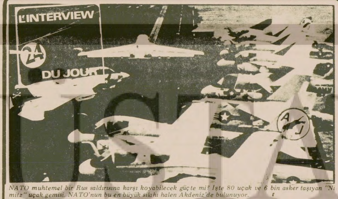
NATO muhtemel bir Rus saldırısına karşı koyabilecek güçte mi? İşte 80 uçak ve 6 bin asker taşıyan "Nimitz" uçak gemisi. NATO'nun bu en büyük silahı halen Akdeniz'de bulunuyor.