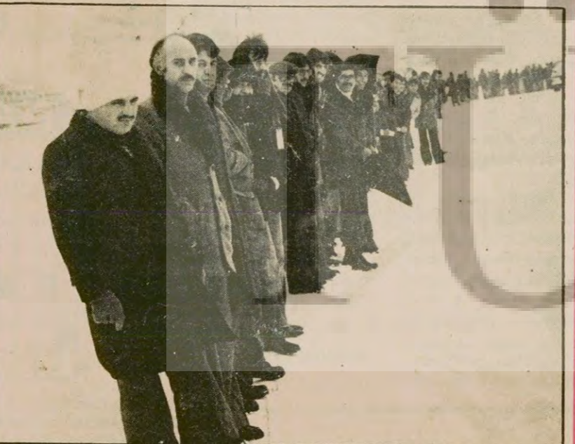
İstanbul'un her yerinde olduğu gibi Topkapı'da da vatandaşlar işlerine gitmek için vasıta bulamadılar, uzun kuyruklar oluşturdular.