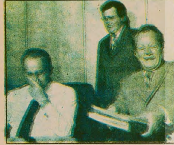
Almanya Başbakanı Willy Brandt'in özel danışmanlığına kadar yükselen ve önemli sıraları çalan Günther Guillaume, Brandt ile Alman senatörleri eski Başkanı Vetter'in arasında görülüyor. KGB, Almanya'da özellikle Doğu Almanları kullanıyor...