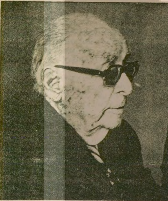
Bayar, "ya devlet başa, ya kuzgun leşe" diyenlerin koçbaşı görevini yapıyor.

İki parti birleştirilirken Demirel'in saf dışı edilmesi planlanıyor İrtibatı AP'den Erkovan, MHP'den Sazak sağlıyor