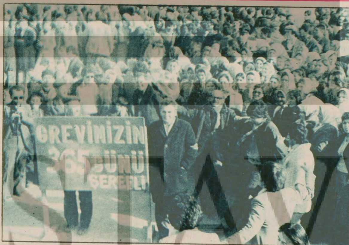
Sancak Tül işçileri, haklarını almak için başlattıkları grevde 365 günü doldurdular. Grevci işçilerin mücadelelerinin başarısına ulaşacağına olan inançları...

"Geçen hafta Ankara dışındaydım. Bizim Ankara dışında bulunduğumuz Cuma gecesi evimin önünde eli otomatik tüfekli üç kişi görülmüştü. Bunu bizim evde olmadı-