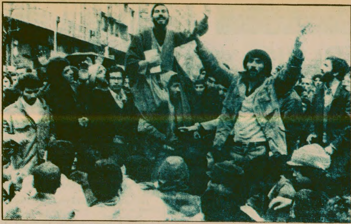
Şah rejiminin yıkılması, İran'da halkın büyük sevinç gösterileriyle kutlanıyor.

Dışişleri Bakanlığına Sencabi, Adalet Bakanlığına Seyyid Cevadi' nin getirildiği açıklandı