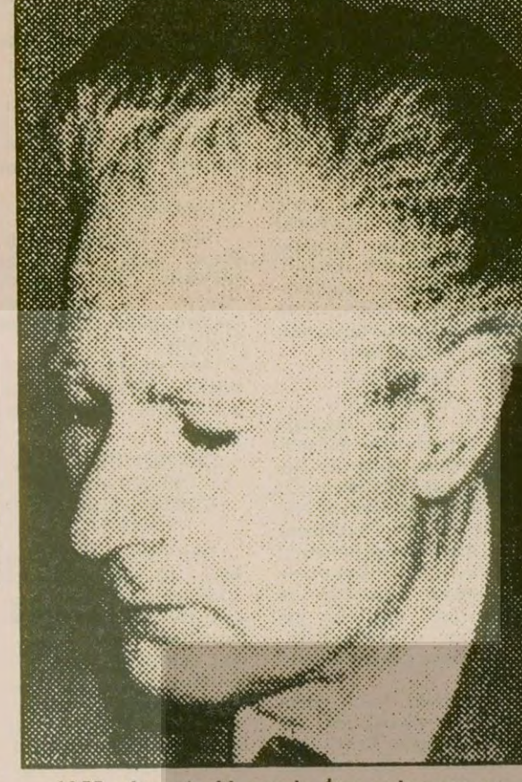
1977 yılının Aralık ayında, İran ordusunun sırlarını KGB ajanlarına sattığı ve KGB'nin casusu olarak çalıştığı için idam edilen İranlı General Ahmet Mogharebi. KGB, rüşvet, şantaj ve çeşitli yollarla, ordu subaylarını bile vatanlarına ihanete zorluyor...

va ziyareti sırasında el atmıştı. Ona, Mısır hükümetinde açıkça Sovyet yanlısı bilinenlerle fazla ilgi kurmamasını söylemiş, tam bir Arap milliyetçisi rolünü oynama görevi vermişti. Sami Şeref, görevi sırasında KGB ile ortak operasyonlar yapılmasını