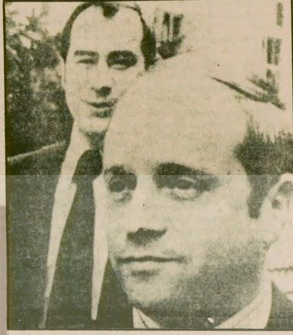
Uluslararası örgütler özellikle Birleşmiş Milletler örgütü ve bu örgüte bağlı kuruluşlar KGB'nin yuvalandığı yerlerdir. Yukarıdaki fotoğrafta 1978 yılının Ekim ayında gizli Amerikan belgelerini çalarak Yakalanan Birleşmiş Milletler'de görevli iki KGB mensubu Rus görülüyor.