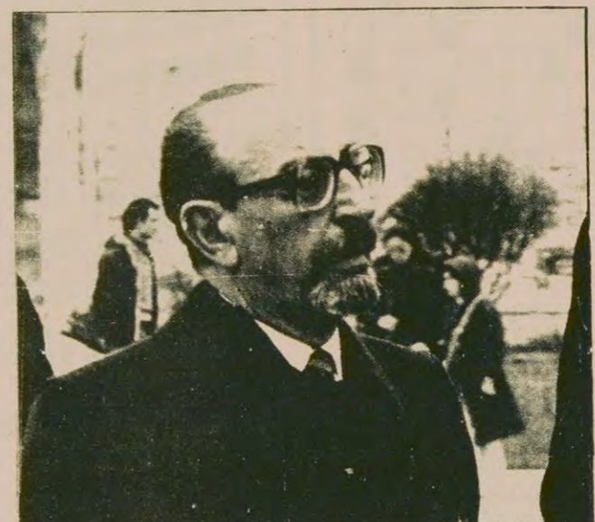
Ankara'daki görüşmelerini tamamlayan Teodoropulos, dün İstanbul'a bir turist gibi geldi. Kısa bir süre için geldiği Topkapı Sarayı'ndan saatlerce ayrılmadı.

Elekdağ-Teodoropulos görüşmesiyle ilgili basın açıklaması yayımlandı