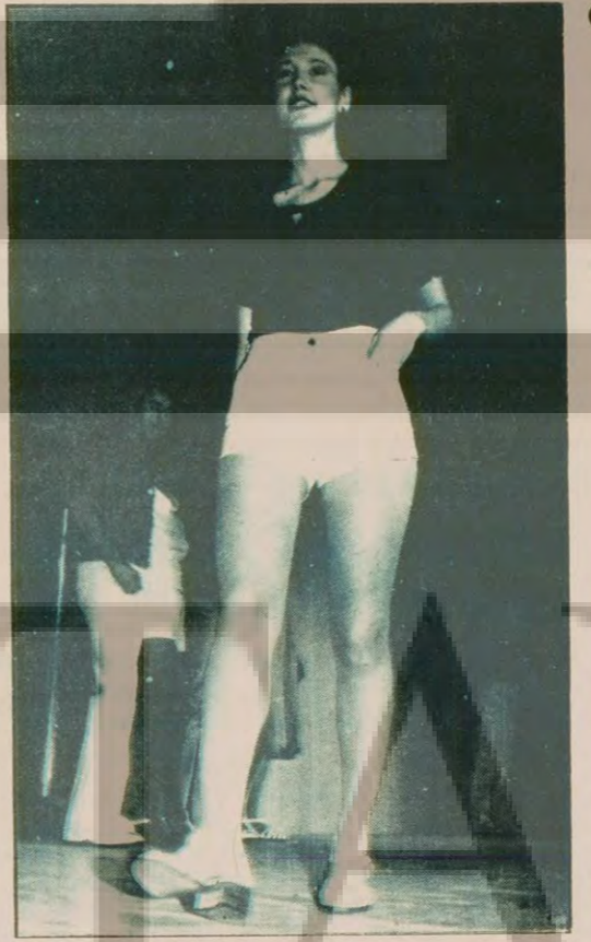
Mayolar 12 bin liraya satılıyor.