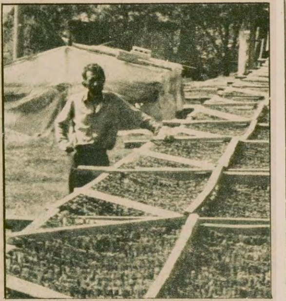
Tütün üreticileri güç durumda.