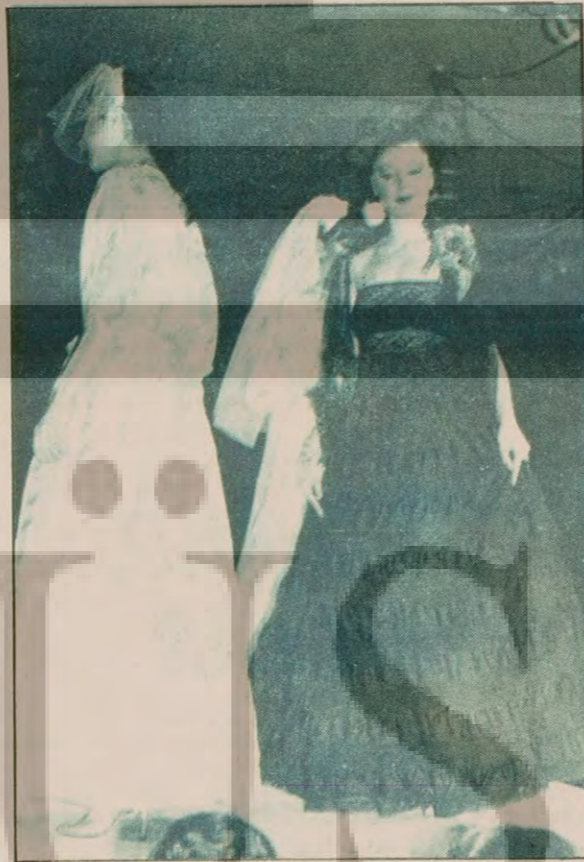
Büyük bir savurganlık vardı. Hilton podyumlarında... Mankenler, izleyicilere üstündekilerini beğendirebilmek için bütün hımerlerini ortaya koydular.