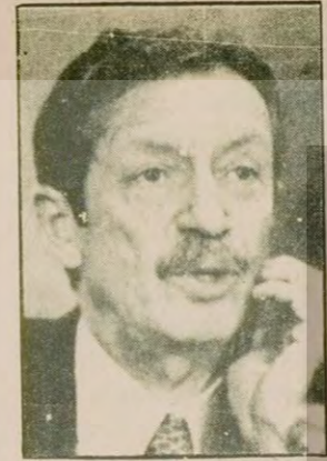
İran Başbakanı Bahtiyar Bahtiyar'a bağlı birlikler Şah ve Homeyni taraftarlarının çatışmasını önlemek ve ordu içinde birlik sağlamak istiyor.