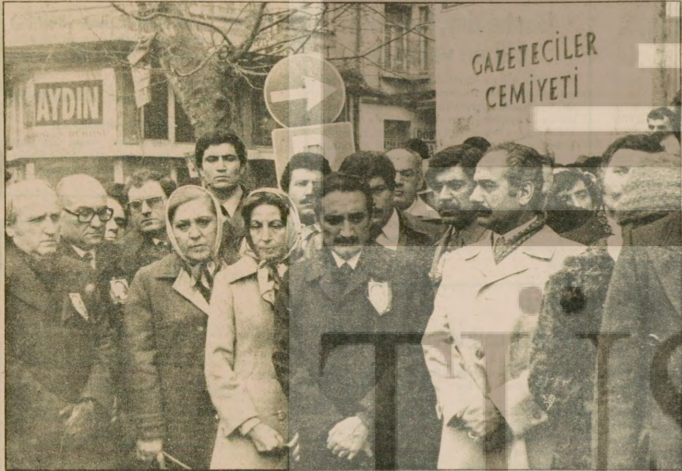
Cenazeye katılanlar soruyordu: "Denge ve uzlaşma siyaseti daha ne kadar devam edecek"