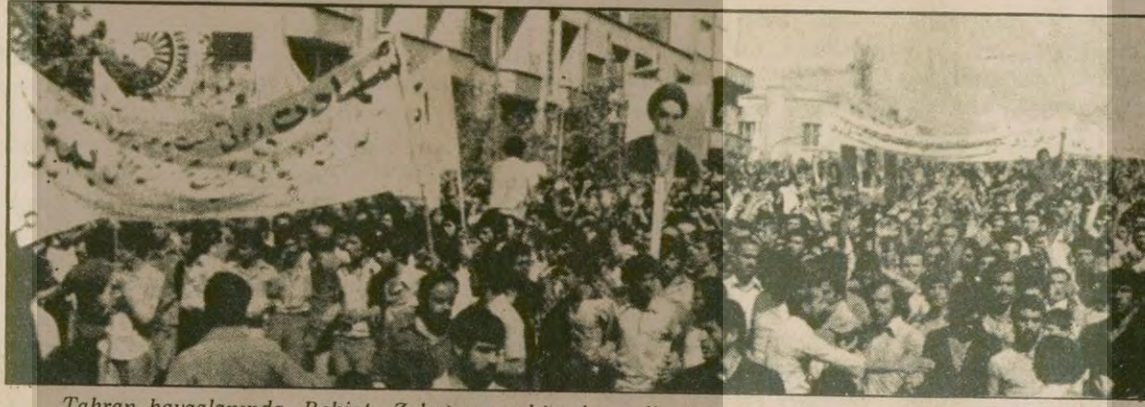
Tahran havaalanında, Behişt-Zehrâ mezarlığında, yollarda sadece Tahranlılar yok: Daha günler önceden yollara düşen yüzbinlerce İranlı, diğer kentlerden akın akın Tahran'a doluyorlar.

İranlılar elele tutuşarak 32 kilometrelik yolu kordon altına aldı