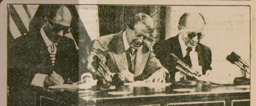
Camp David Zirvesinin toplanması için çaba sarfeden Carter, yeni bir zirvenin sözkonusu olmadığını söyledi.

"SAVAK'ın yerine daha geniş ve büyük bir örgüt kuracağım. Ve saltanata karşı olanların tümünü imha edeceğim. Hiç kimseye en küçük bir kırpımdan, hareket ve muhalefet hakkı tanımayacağım. Bu olaylardan SAVAK yöneticileri de sorumludurlar. Çünkü bize karşı olan unsurlar onların zamanında gelişti. Artık böyle şeylere izin vermeyeceğim."