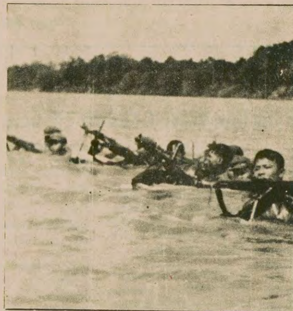
Kamboçya Komünist Partisi Merkez Komitesi Askeri Komisyonu, Devrimci Halk Ordusuna bir çağrı yaptı. Çağrıda halk savaşının kararlılıkla sürdürülmesi ve direnişin nihai zafere ulaştırılması istendi.