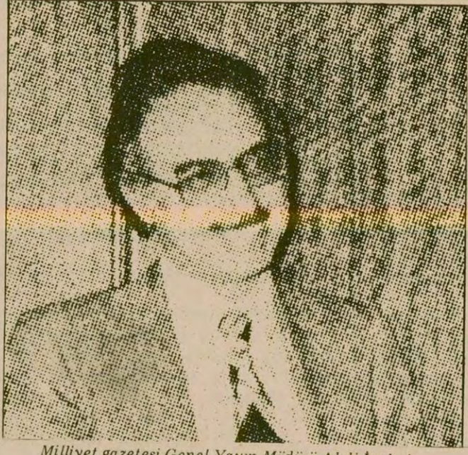
Milliyet gazetesi Genel Yayın Müdürü Abdi İpekçi.