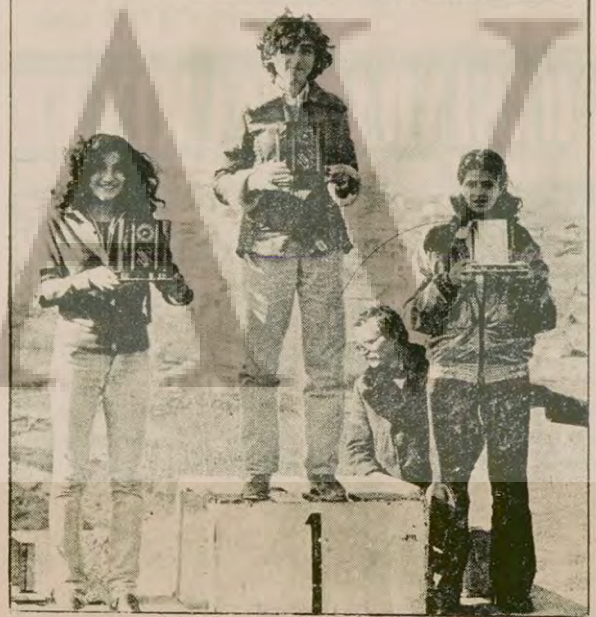
Genç Kızlar 2000 metre yarışında dereceye giren atletler.