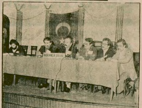
Elektrik Mühendisleri Odası 20. olağan Genel Kurulunda divana seçilenler ve konuşma yapan bir üye.

Kongrede Yurtsever Mühendis grubu tarafından verilen, Kahramanmaraş katliamının sorumlusu Kontrgerilla ve MHP'den hesap sorulmasını ve hükümetin katillerin üzerine gitmede daha cesur davranmasını isteyen önerge kabul edildi.