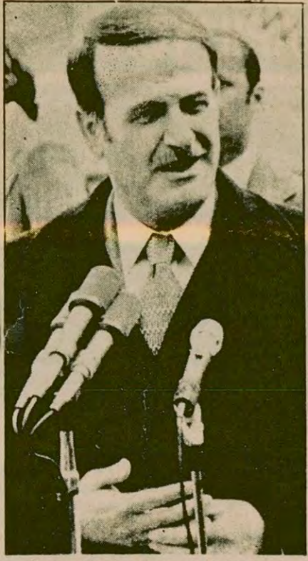
Suriye Devlet Başkanı Hafız Esad.