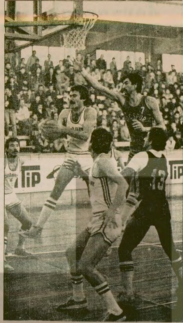
DSİ Spor-Taçspor maçında bir pota altı mücadelesi.

ler, Zaman zaman DSİ Spor öne geçti. Özellikle Turan'ın iyi oyunuyla Taçspor maçı 87-77 kazandı.