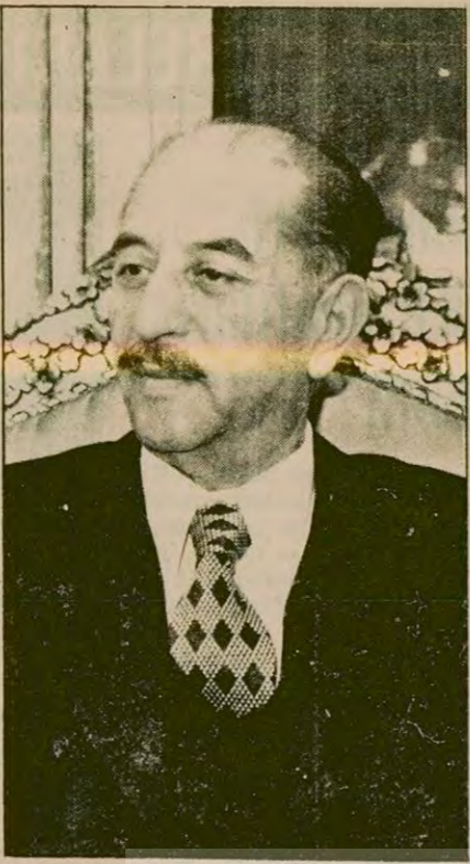
Irak Devlet Başkanı Hasan El Bekr.