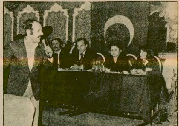
Kimya Mühendisleri Odası 25. genel Kurulunda eski yöneticileri eleştiren bir konuşmacı.

Çalışma Raporunun eleştirisi bölümünde denetçiler odanın hesapla-