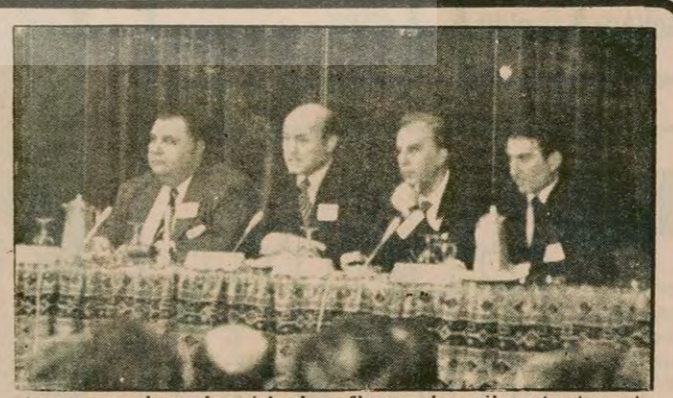
h.azısmacıların hepsi hızlı enflasyondan şikayet ediyordu.

Büyük işadamları, bunalımdan çıkışı yabancı sermayede görüyor