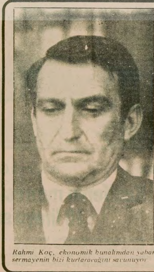
Rahmi Koç, ekonomik bunalımdan yabancı sermayenin bizi kurtaracağını savunuyor