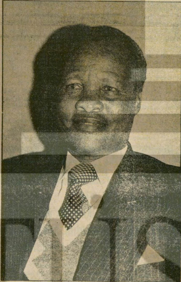
Güney Afrika ırkçı rejiminin siyahların bağımsızlık mücadelesini bölmek amacıyla, 1976'da kurulan Transkei'nin kukla Başbakanı Kaiser Danconga Manzuma