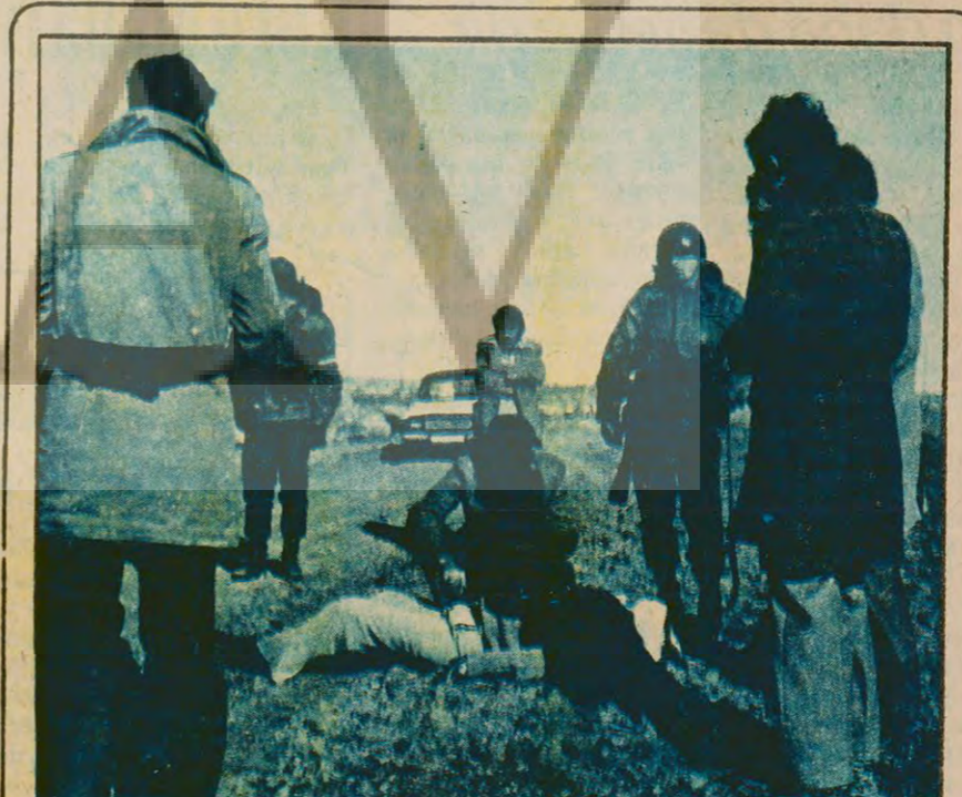
Güneydoğu da sınır boyunca yaşayan yurttaşların en azılı düşmanlarından biri de mayınlar.