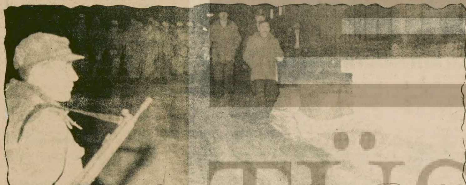
Sağmalcılar Cezaevi... Mahkumlar kaçtı. Defalarca isyan çıktı. Tutuklu ve hükümlülerin huzursuzluğunun nedenlerine yine de eğilinmiyor...

İran'da Bahtiyar Hükümeti ve ABD'nin tutumu Yazısı 3. Sayfada