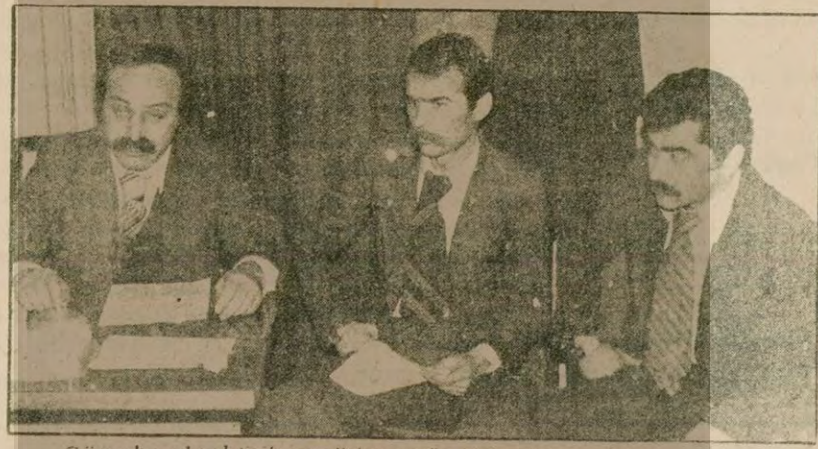
Görevde el çektilen polisler, açığa alınmalarına neden olan basın toplantısında.

Bütçe komisyonunda kavga çıktı AP ve CHP'liler birbirinin üzerine yürüdü