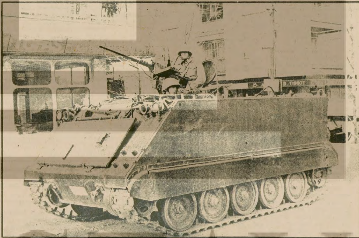
Kariyerler, saat 9.00'da Yürükselim'e girerek halkı evlerine soktu. Daha sonra Çamlık'a çıkarak geri döndü.