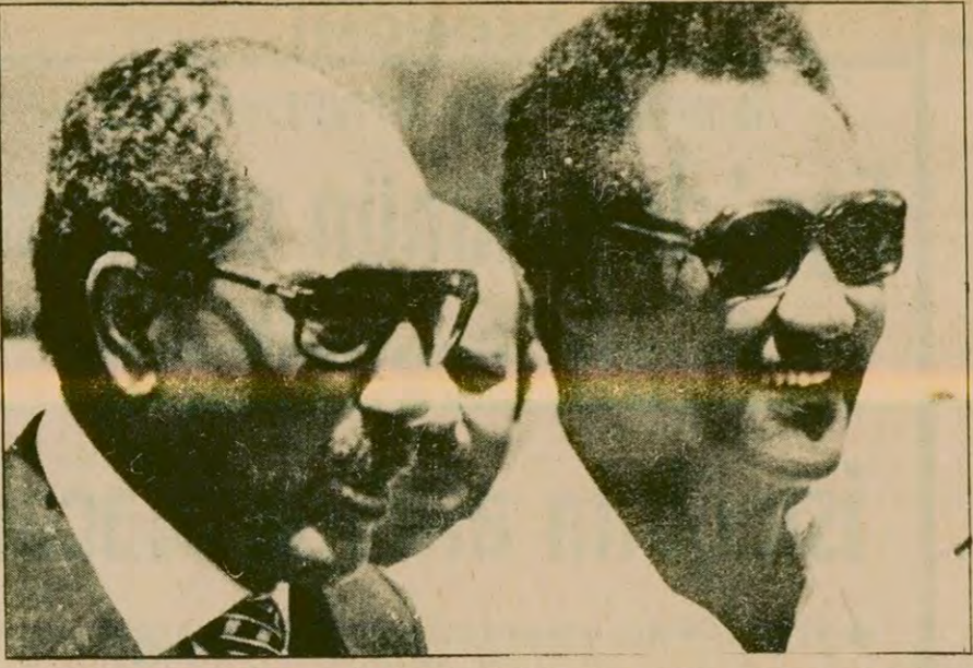
Sudan Devlet Başkanı Numeiri, Sedat'ı her yönden desteklediklerini açıkladı.

Mısır Devlet Başkanı, Mısır-Sudan Ortak Parlamento grubunda konuştu