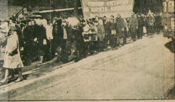
Vietnam işgalini protesto eden göstericiler Vietnam Büyükelçiliği önünde.

İspanya'da halen bir milyon üstünde işsiz var. Ülkede kendiyeneye iş bulmaya çalışılanların sayısının da onbinleri bulduğunu bildiriliyor.