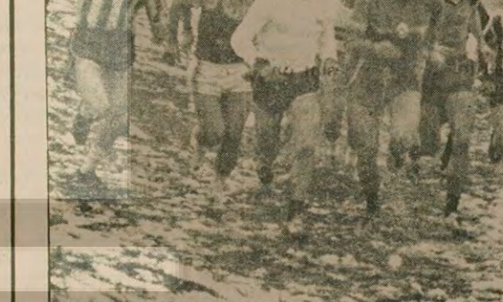
Büyük Erkekler 12.000 metre yarışı görülüyor.