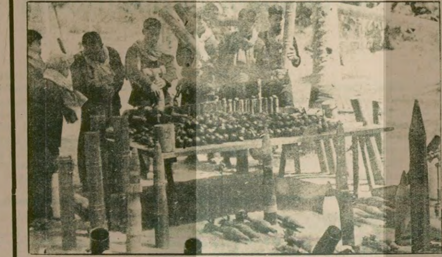
Kamboçya Devrimci Halk Ordusunun, Vietnam'ın geçen Haziran ayında giriştiği saldırılar sırasında ele geçirdiği Vietnam silah ve mühimmatının bir kısmı

Pol Pot ve Kiyö Samfan halk savaşının en önünde dövüşüyor"