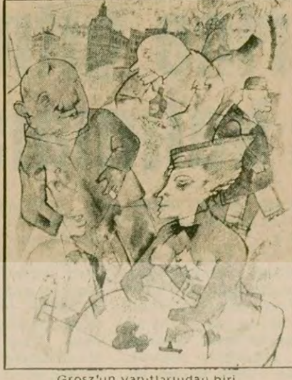
Grosz'un yapıtlarından biri

girir. 1918'de ilk kişisel sergisini açar. "İflas 1919-1924", "Herkes Kendinin Ayaktopu "Bıçak Kemige Dayandı" dergilerinin kuruluşuna katılır. 1919'da Dadaist Tiyatro gösterilerine katılır.