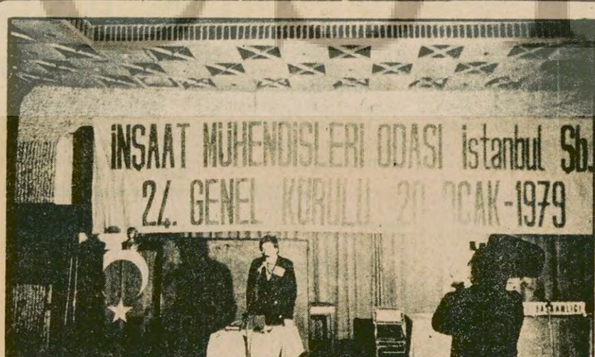
Önceki gün yapılan İnşaat Mühendisleri Odası İstanbul Şubesi Genel Kurulunda bir delega konuşurken