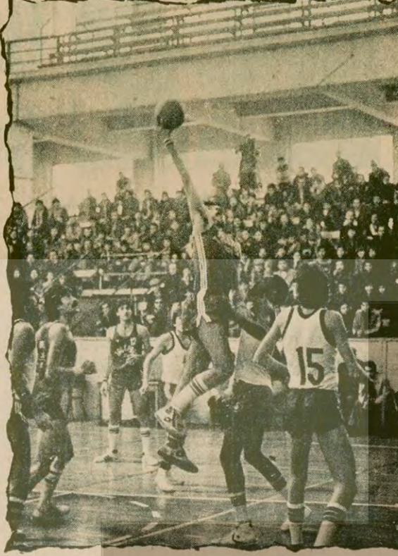
Şekerspor-Taçspor maçından bir pota altı mücadelesi.