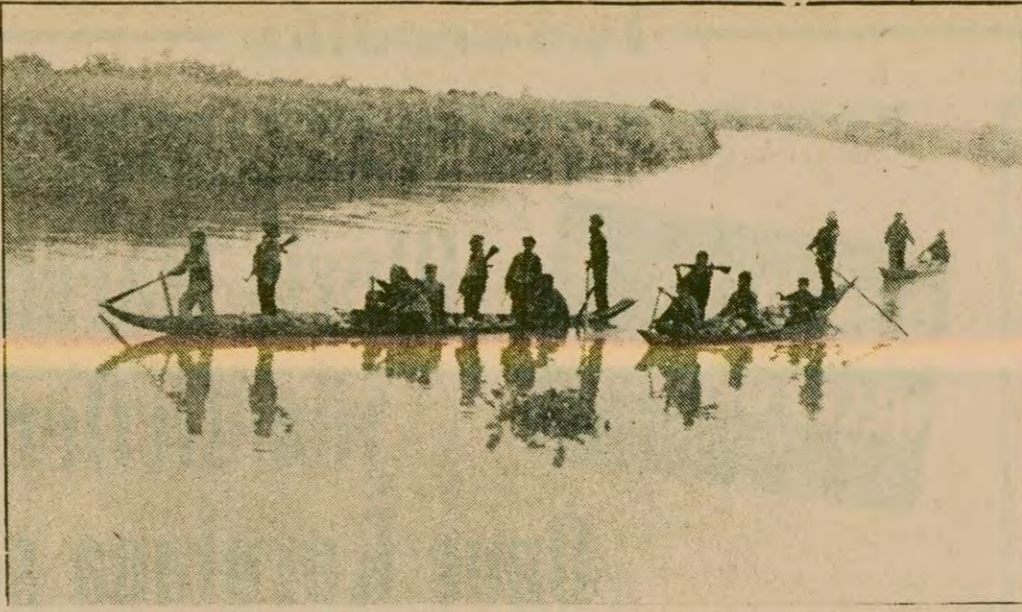
Vietnam'la Kamboçya'yı birbirinden ayıran Tonle Bassacelva nehrinde, muhtemel bir Vietnam saldırısını göğüslemeye hazırlanan Kamboçya Devrimci Halk Ordusuna bağlı kıyı devriyerleri.

Demokratik Kamboçya Başbakan Yardımcısı İeng Sary, Kamboçya'daki sòngelişmelerle ilgili bir açıklama yaptı: