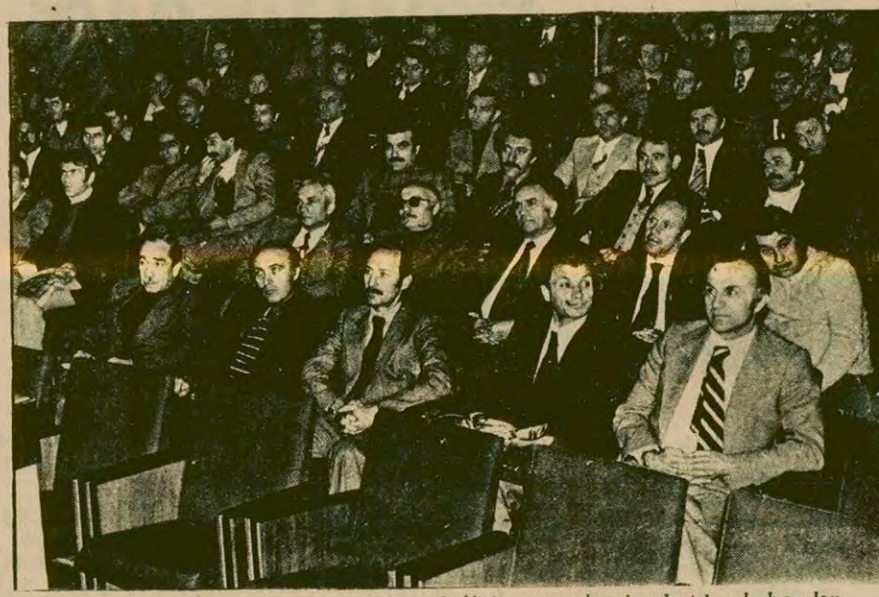
Futbol Federasyonunun düzenlediği ara seminerine katılan hakemler