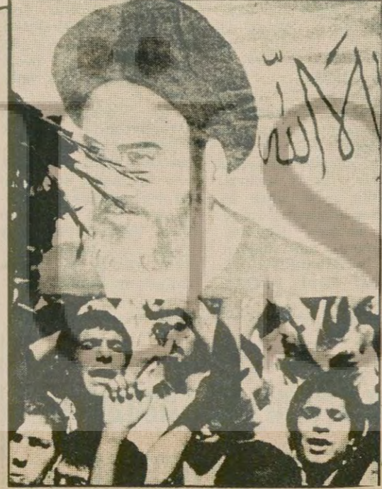
Şah'ı ülkeden kovmak için halk dün de çeşitli gösterilerle zaman geçirdi.

CHP Milletvekilleri Kamboçya'nın işgali konusunda ne dediler... Yazısı 7. Sayfada