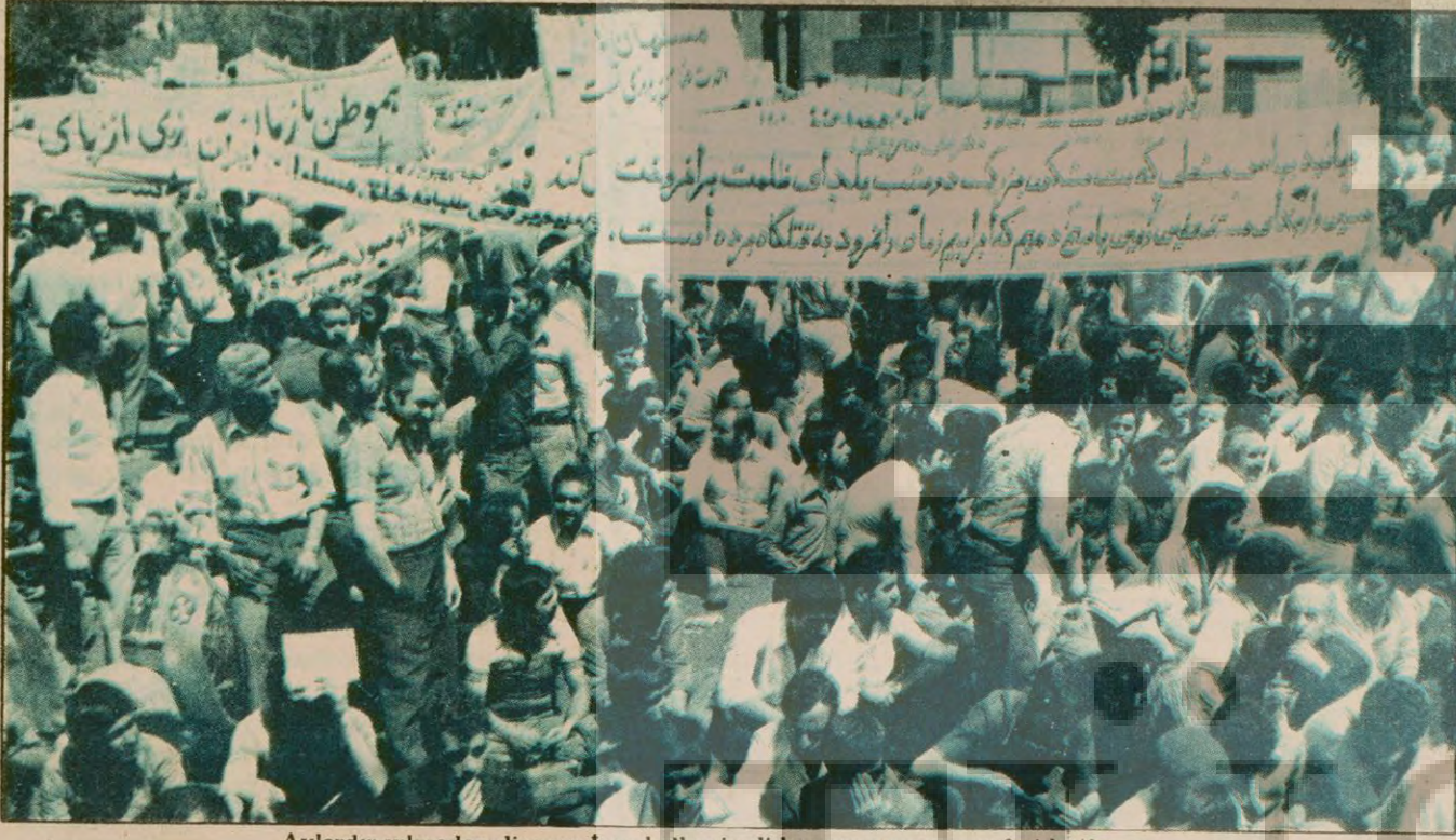
Aylardır yılmadan direnen İran halkı şimdi bayram yapıyor, zaferi kutluyor.