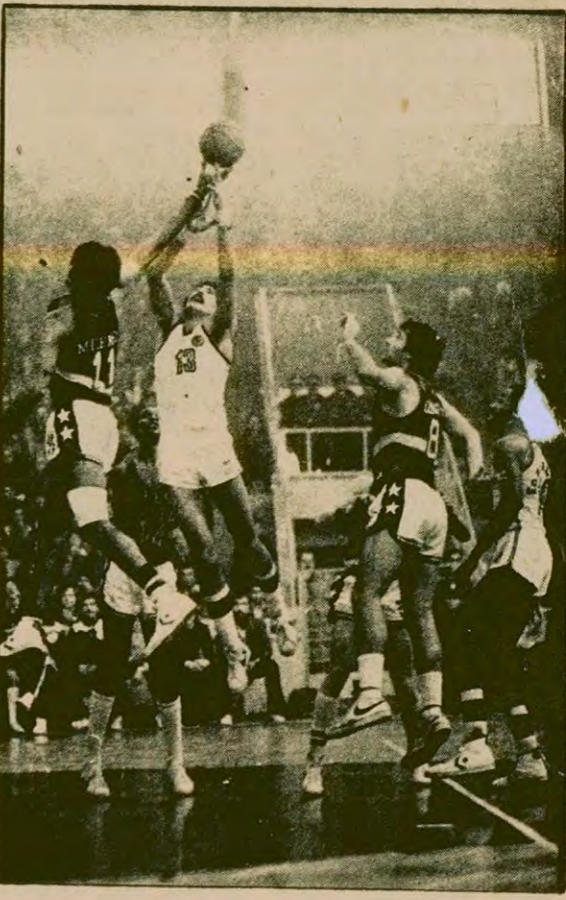
Eczacıbaşı-Efes Pilsen karşısında oldukça başarılıydı...