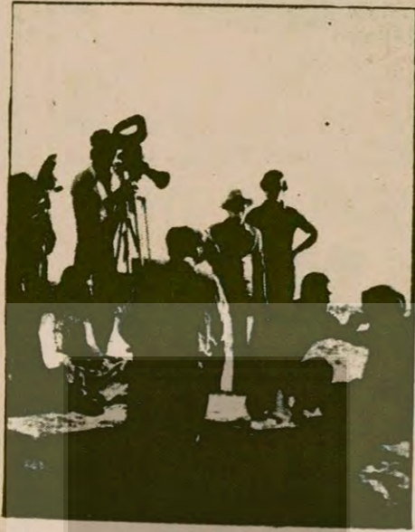
"Hayatım Roman" filmi çekilirken...

Öyle bir konu olmalıydı ki, kahramanı olağanüstü işler yapmasın, gerçek anlamda