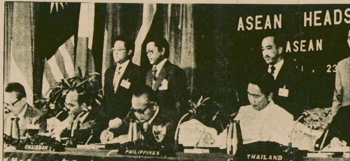
ASEAN (Güneydoğu Asya Ülkeleri Birliği) zirve toplantısında, Singapur, Malezya, Endonezya ve Filipinler devlet başkanları bir arada görülüyor.

DIŞ HABERLER SERVİSİ Siper devletlerin Güneydoğu Asya ülkelerine karşı girdiği müdahale ve ekonomik sızma emellerine karşı ASEAN (Güneydoğu Asya Ülkeleri Birliği) ülkeleri aralarındaki ekonomik yardımlaşma ve işbirliği bağlarını gün geçtikçe sağlamlaştırıyorlar. ASEAN ülkeleri arasındaki ticaret hacmi 1975 yılından bu yana hızla gelişti. 1975 yılına nazaran 1977 yılında ticaret hacmi, Malezya ile Filipinler arasında yüzde 24, Singapur ile