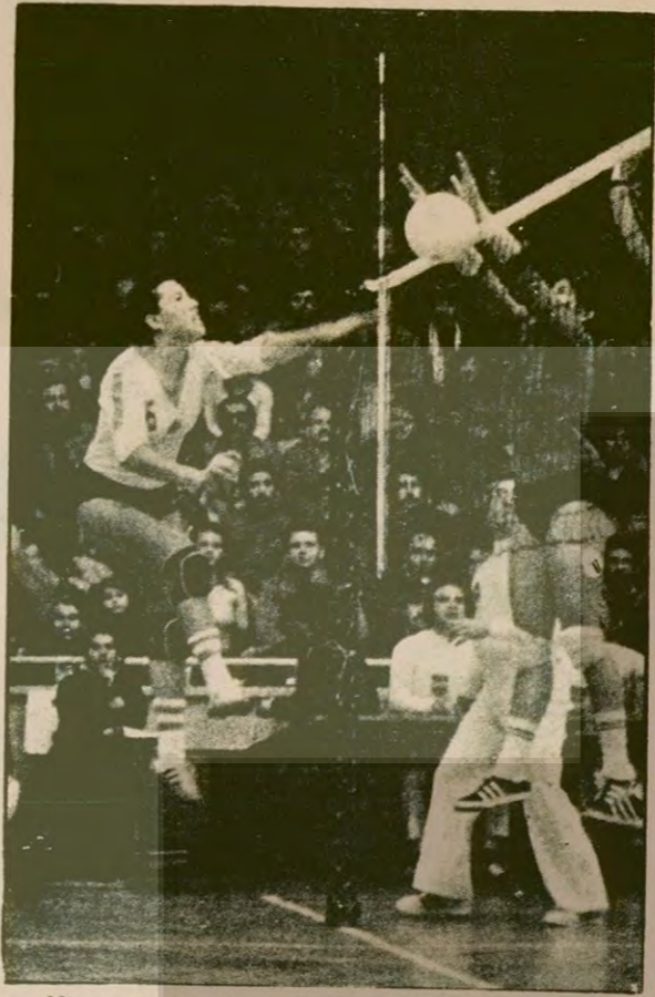
Nimse Budapeşte güçlü fiziki ve oyun taktiğiyle başarılı bir oyun çıkardı...

ECZACIBAŞI: 0 SALON: Anadolu NİMSE BUDAPEŞTE: 3 Spor Sitesi.