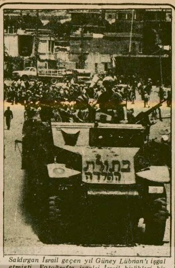
Saldırgan İsrail geçen yıl Güney Lübnan'ı işgal etmişti. Fotoğrafta işgalci İsrail birlikleri bir Lübnan kasabasında...

Yorumda ayrıca, sarhoşluk nedeniyle pek çok kişinin öldüğü, pek çoğunun da sakat kaldığı kaydedildi. Büyük fabrikalarda maaşların ödendiği gün ise, meyhanelere koşan işçiler yüzünden üretimin bazen yüzde 30 oranında aksadığı belirtildi.