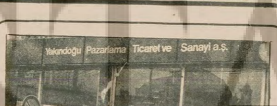
Yakındığı Pazarmaya Tüccar ve Sanayi a.Ş. DÖVİZLE MAGİSUS HİBRİSİ

Bu soru bizim de kafamıza takıldı ve mecliste kendileriyle görüştük. Karacız'ın eski bir sanatçıya "yoksa milletvekili mi?" diye sorduk. "Eştağ-furullah" dediler, "biz sayılab değil milletvekilliyiz." Bazıları Rusyayı "komünist" gömediklerini söylediler, bazıları da TKP'ye karşı olduklarını.