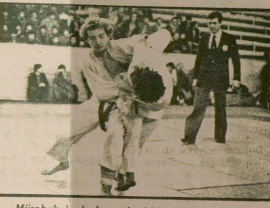
Müسابakalarda bazı aksaklıklar dikkatleri İstanbul Judo Ajanlığının üzerine çekti...

Uluslararası Barış Turnuvası Judo Şampiyonası Yunanistan ve İtalya'nın birer, Türkiye'nin de üç takımıyla katılımıyla başladı. Daha önce katılacakları söylenen Irak, Cezayir, Romanya ve Bulgaristan şampiyonası katılmadılar.