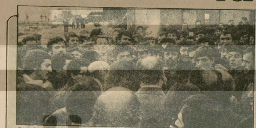
Dok Gemi-İş Başkanı Aslan Sivri işçilerin ortasında.