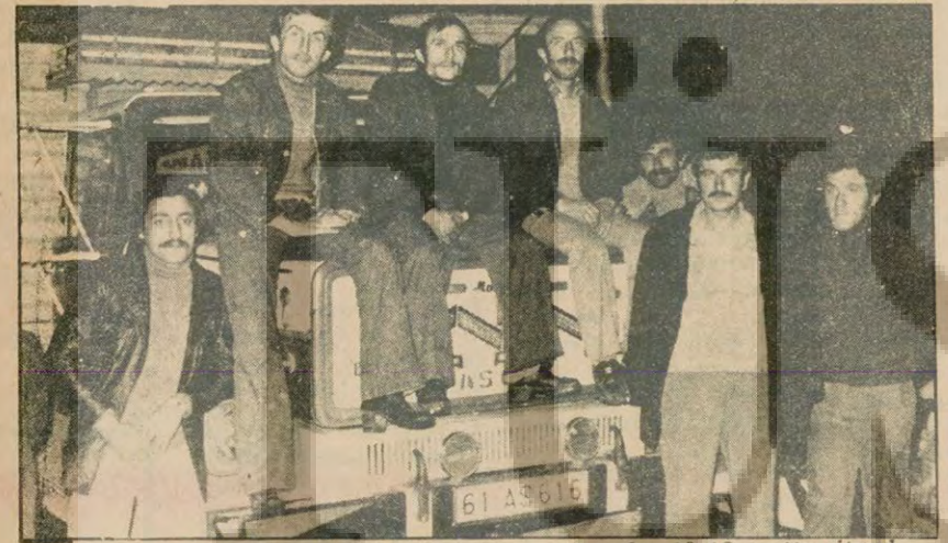
Hamsi taşıyan kamyon şoförleri "18-20 saatlik yolu, 10-12 saatte gitmek zorundayız. Her zaman kelle koltukta."

Hamsinin en bol olduğu Sinop limanında bine yakın balıkçı var. Simonye kadar TRT ve oasin, bankıç devince mikrofonlarını hep yanında balıkçı çalıştırarak büyük motor sahiplerine veya balığın pazarlamasını yapan manavlara tuttu. Biz de başka şehirlerden gelecek hamsi mevsiminde Sinop'ta balıkçılık yapanlarla konuştuk.