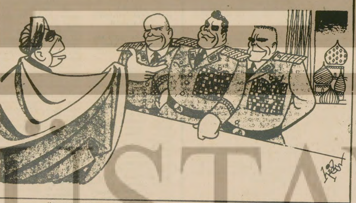
"Ayetullah" Brejnev: "Bu kılıkla İran'a gitsem rağbet görür müyüm dersiniz?"