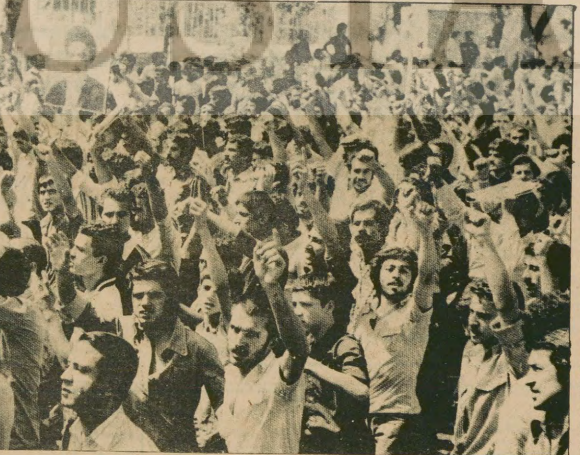
İran halkı Şah rejimini kökünden silip süpürmekte kararlı. Yeni bir İran doğuyor: Bağımsız ve demokratik İran.

Bütün dünya Rusya'nın İran'ın kuzeyinde bir askeri hareket hazırlıklarında olduğunu biliyor. Sosyal-emperyalistler bir yandan da İran'a yapacakları bir müdahalenin zeminini yaratmaya çalışıyorlar. Bu amaçla da çeşitli iddialar ileri sürüyorlar. Bu iddialardan biri de şu: "Şah yıkılırsa ABD Azerbaycan'da bir devlet kurma hazırlıkları içinde, bu devleti Rusya'ya karşı bir savaş üssü olarak kullanacak..."