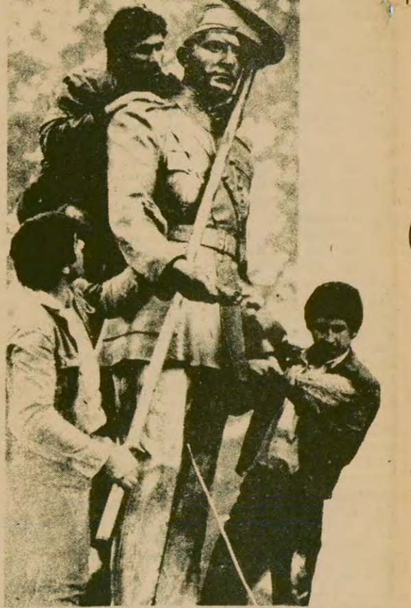
İşkencenin, baskının, kara zulmün sembolü Şah. Halkın coşkun seline kapıldı. Önce heykelleri devrildi bir bir. Bu sel geldi saraya dayandı. Şimdi de onu devirecek...