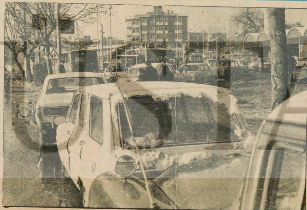
Arabalar benzin kuyruğunda. İnsanlar arabalardan umudu kesmiş yürüyor. Kışın ortasında bir ton kömür alarak ısıtmaya çalışan vatandaşlar... Öte yandan Belediye Başkanının penceresinin baktığı kaldırımda için eğlencesinde çocuklar, süpürdümüm karları kayarak cam gibi buz etmişler... İhtiyaçları düşe kalka yürüyor...

4 Batılı liderin Guadeloupe Zirvesi bugün tamamlanıyor B.ALMANYA VE ABD, TÜRKİYE'YE YARDIM YAPILMASINI SAVUNUYORLAR 5. Sayfamızda