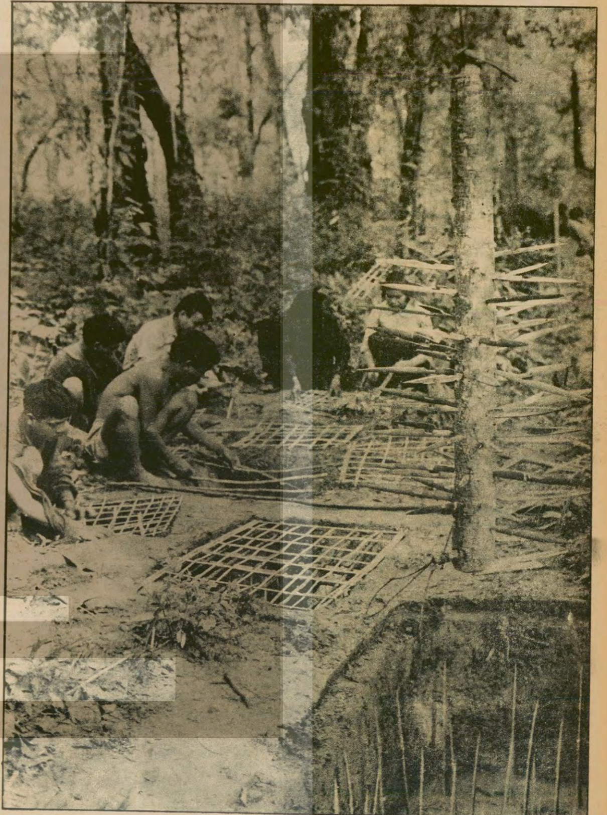
Kamboçya halkı, bir zamanlar ABD emperyalistlerine karşı kullandığı akıl almaz mücadele yöntemlerini, şimdi de Vietnam'a karşı yurdunu savunmak için kullanıyor...

Bir Kamboçya heyeti BM toplantısına katılmak üzere gelecek hafta New York'a gidiyor