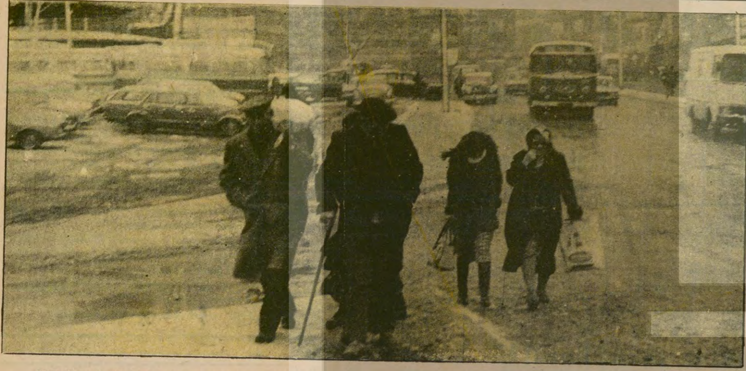
SOĞUK HAVA YURDUN BATI KESİMLERİNDE ETKİSİNİ SÜRDÜRÜYOR