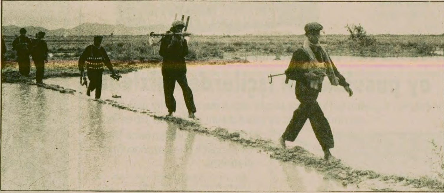
Kamboçya devrimci ordusunun askerleri. Anavatanı savunmada hiç bir fedakarlıktan kaçınmıyor...