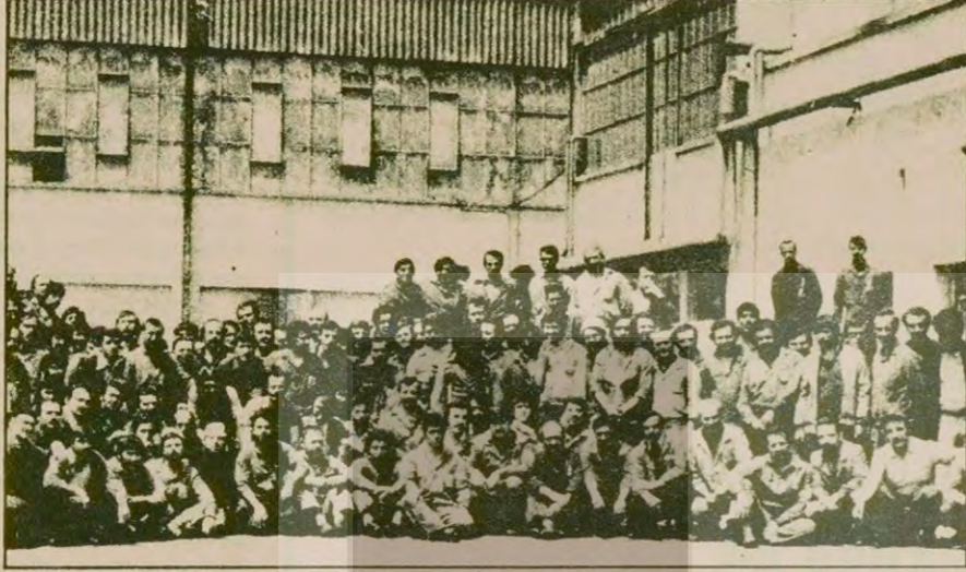
UZEL işçileri temsilci seçiminden sonra oyların açıkta sayılmasını istedikler. IGD'liler bunu engelledi, kendileri okudular, kendileri yazdılar ve sorunda kazandıklarını ilan ettiler. UZEL işçileri soruyor: "Bu nasıl seçim?"