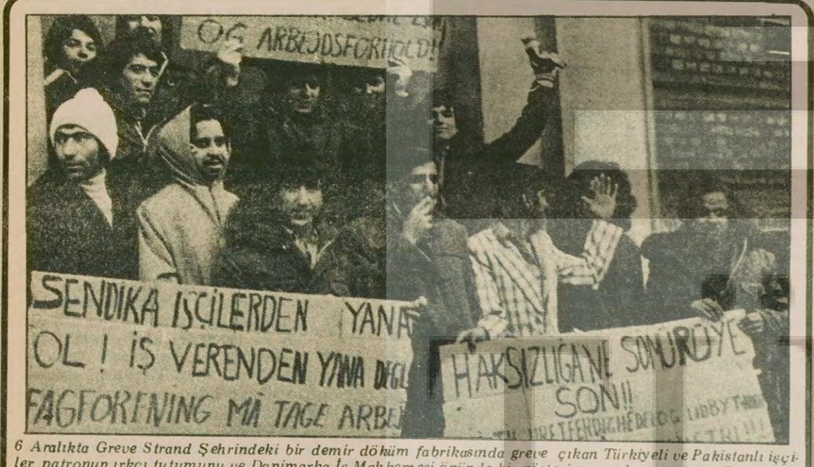
6 Aralıkta Greve Strand Şehrindeki bir demir döküm fabrikasında greve çıkan Türkiyeli ve Pakistanlı işçiler, patronun irki tutumunu ve Danimarka İş Mahkemesi önünde bir gösteri yaparak protesto ettiler.

Fransız revizyonistlerin düzenlediği toplantıda sahte TKP'nin Türkiye'deki faaliyetleri olarak IKD, IGD ve Maden-İş'in çalışmaları anlatıldı. Yukarıda toplantının çağrı bildirisi!