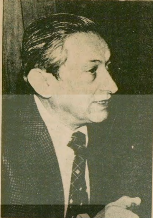
Özalp, CHP Grubunun isteği üzerine görevi bıraktı.