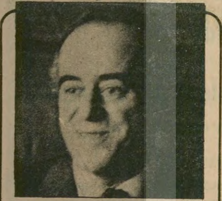
Sanayi Odaları Birliği Başkanı Sabancı

ANKARA (THA) AP Genel Sekreteri Nuri Bayar, İçişleri Bakanının istifasıyla ilgili olarak "önemli olan hükümetin istifasıdır. Özalp'ın istifasıyla birlikte hükümet de istifa etmeliydi" dedi. Nuri Bayar bu konuda şöyle konuştu: "Önemli bir gelişme saymıyoruz. Bizim için ve Türkiye için önemli olan hükümetin istifasıdır. "Bu nevi yüzeyel tedbirlerle hükümeti kurtarmak mümkün değildir. Türkiye için önemli olan Ecevit hükümetinin istifasıdır. Özalp'ın istifası anarşinin önlenememesinin bir sonucudur. Ancak bunu sadece İçişleri Bakanına bağlamak mümkün değildir." (Devamı Sa.7, Sü.2'de)