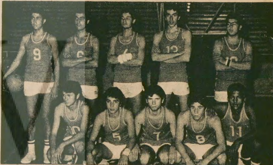
50. Yıl Erkek Lisesi basarılı sonuçlar aldı.

Merkez Hakem Komitesinin kendisini haksız olarak klanından çıkardığını savunan Salar, Danıştay 1. Dairesinden alınan kararın iptalini istedi.