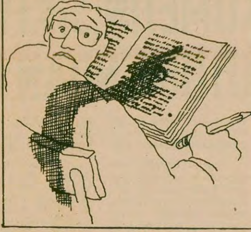
Karabaş'ın birincilik alan yapıtı.

Yılmaz'ın anlatımı da "Kibar Feypo"daki zenginlikten, açlıktan yoksun, "Düğüne bir fotomantokun tekniği egemen sinema diline. Film, daha çok Sunal'ın espri-leri ile ayakta durabiliyor. Kullanılan birçok espri de alışılmış, sıradan şeylerin ötesine geçmiyor. Sunal'ın "ben yakışıklı mıyım?, yakışıklıyım değil mi?" gibi yüksek sesle düşündüğü bölümler gibi. Kemal Sunal, ülkemizin toplumsal sorunlarına aptal olmayan saf kahramanları canlandırarak eğildiği zaman çok daha etkili olacaktır kanısındayız. Sunal'ın Atif Yılmaz'la işbirliğinden ise çok daha güçlü filmler ortaya çıkabileceğini düşünüyoruz.