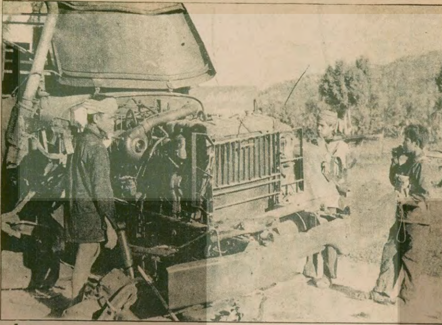
Pnom Pen radyosu, 25-28 Kasım tarihleri arasında Kuzeydoğu Kamboçya sınırında meydana gelen Vietnam saldırısını geri püskürttüğünü açıkladı. Radyo, 7 numaralı karayolu boyunca yapılan çatışmalarda, üç tank, dört top ve altı kamyonun imha edildiğini bildirdi. Resimde, Kamboçyalıların Ocak ayında ele geçirdikleri bir Vietnam kamyonu görülmüyor.

Askeri uzmanlar, kuzak mevsiminde yapılan savaşın, Mekong Irmağı'nı ele geçirmek olduğunu bildiriyor.