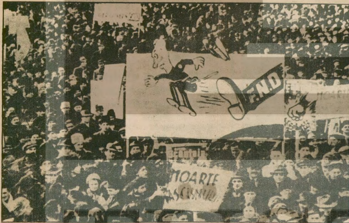
1945'te Alman işgaline ve işbirlikçi hükümete karşı başkaldıran kitleler milli demokratik bir hükümetin kurulmasını için gösteri yapıyorlar...

1943 sonbaharında Almanlara karşı kurulan milli cepheye Partinin