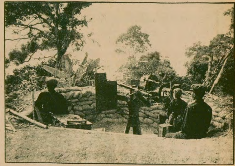
Kamboçya toprakları sık sık Vietnam'ın saldırılarına uğruyor. Ama Kamboçya halkı, ülkesinin bağımsızlığını ve devrimin kazanımlarını korumaya kararlı. Bir yanda başarıyla sosyalizmi inşa ediyor, diğer yanda elde silah saldırganlara karşı koyuyor.