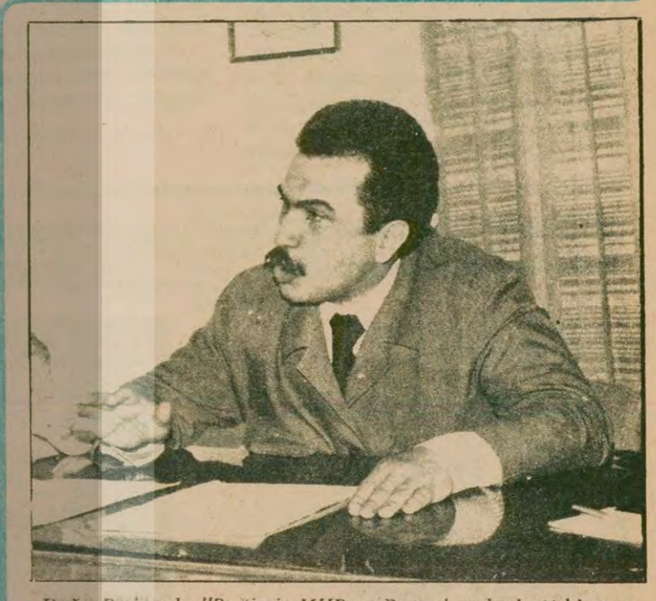
Doğu Perinçek: "Partimiz MHP ve Rusya'nın kıskırttıkları gerici iç savaşta ve mezhep kavgalarına karşı mücadele ediyor."

MHP yöneticileri ve taraftarı basın şimdi kendi cinayetlerini başkalarının üzerine yıkıp, nefes almak için bir kampanya başlattılar. K. Maraş'ta sözde inceleme yapan MHP'li milletvekilleri tertipin "Maocu Aydınlık grubu" tarafından gerçekleştirildiğini öne sürdüler. TBMM'de konuşan MHP Milletvekili Sadi Somuncuoğlu da aynı doğrultuda iddialar ortaya attı. Bu arada MHP yayın organı Her gün dünki sayısında gazetemizi ve devrimcileri hedef alan geniş bir yayın yaptı. Her gün, gazetesi gazetemizin daha önceki sayılarında açıkladığımız MHP'nin K. Maraş'ta tertiplerini hazırladığı şeklindeki açıklamaları iddialarına mesnet olarak göstermeye çalıştı. Tercüde (Devamı Sa.7, Sü.4'de)