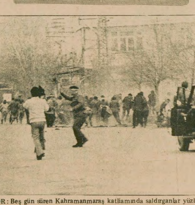
SALDIRGANLAR KAÇIYOR: Beş gün süren Kahramanmaraş katliamında saldırganlar yüzlerce yurttaş katletti. Saldırganlar zaman zaman güvenlik kuvvetlerine kovalandılar. .

MARŞ'TAN ADANA'YA GETİRİLEN YARALILARLA GÖRÜŞTÜK