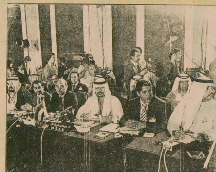
OPEC ülkeleri temsilcileri Katar toplantısında

Yüzde 14,5 luk fiyat artışı OPEC ülkelerinin, doların değerindeki düşüştürten kaynaklanan gelir kayıplarını karşılayamıyor OPEC Petrol Bakanları 1979 yılı sonunda toplanarak 1980 yılı fiyatlarını yeniden saptayacak