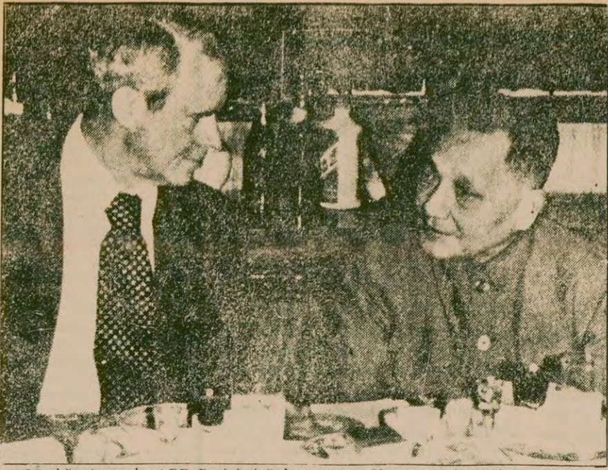
1977 Ağustosunda ABD Dışişleri Bakanı Cyrus Vance ve Çin Halk Cumhuriyeti Başbakan Yardımcısı Deng Siao-ping, iki ülke arasında diplomatik ilişki kurulmasını görüşüyorlar.