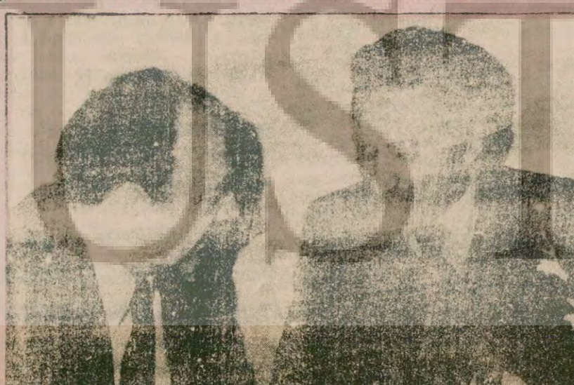
Ecevit, Norveç'e geçmeden önce, Kopenhag'da Danimarka Başbakanı Jorgensen'le görüştü.