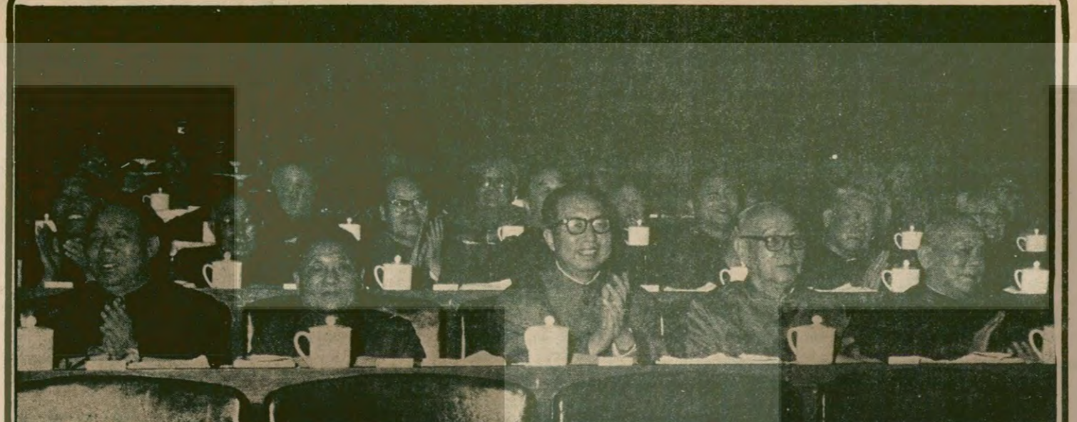
Vang Tung-sing Çin Komünist Partisi Başkan Yardımcısı, Deng Siao-ping Çin Komünist Partisi Başkan Yardımcısı, Hua Guo-feng Çin Komünist Partisi Başkanı, Yeh Çien-ying Çin Komünist Partisi Başkan Yardımcısı, Li Sien-nien Çin Komünist Partisi Başkan Yardımcısı

ya'nın ve Küba'nın askeri bakımdan daha da gelişmesine olanak verecek bir "SALT 2" anlaşmasını onaylanmayacağını açıkladı.