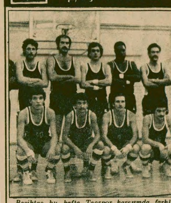
Beşiktaş bu hafta Taçspor karşısında farklı galibiyet aldı.