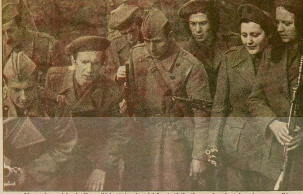
Yugoslavya'da halk müislerinin katıldığı tatbikatlar, sık sık tekrarlanıyor. Bir saldırgan karşı sürrekli olarak halk uyanık tutuluyor.

Savunmayı geliştirmek, halkın silahlanmasını sağlamak için "Ansızın Yakalanmayalım" adıyla tatbikatlar yapıyoruz