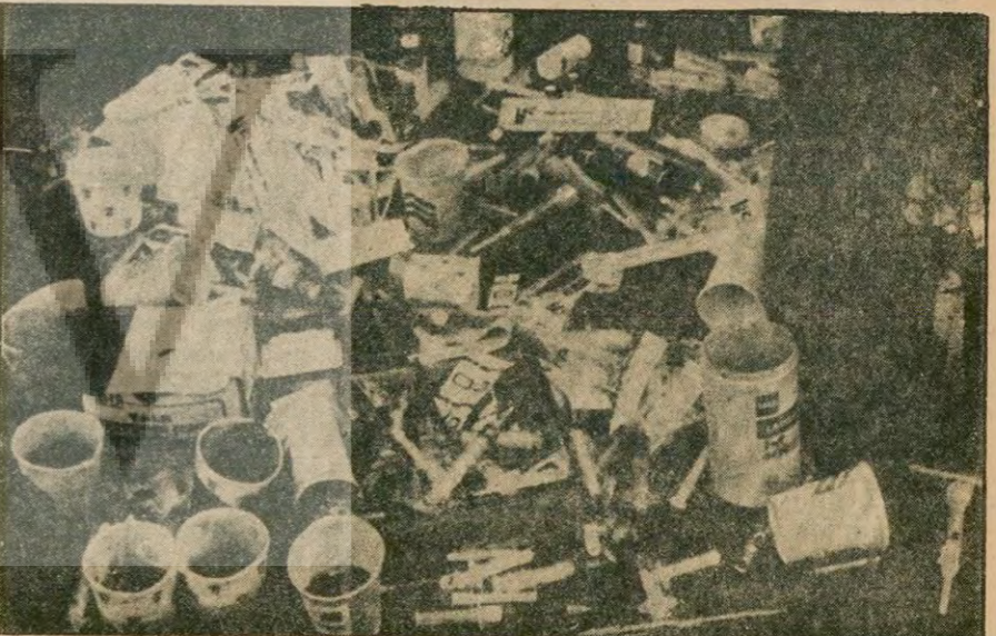
Toplu intiharda kullanılan, çeşitli araçlar. Enjeksiyonlar, siyanürlü su içilen "botalar"...

Orta Doğu artık birkaç yıl öncesinin Orta Doğusu değil, Brejnev'in hegemonyacı saldırılarının, faaliyetlerinin önünde her gün yeni yeni dalgaların yükseliyor. Suriye'nin, Rusya'nın baskıları karşısında, henüz başlangıç da olsa takındığı tutum, bu dirençin bir örneği sayılmalıdır. Ve Suriye'nin bu davranışı, Orta Doğu'nun ve dünyanın diğer ülkelerine, özellikle de, pusulayı hâla Kremlin'in kiblesine göre ayarlayanlara olumlu bir örnek sayılmalıdır.