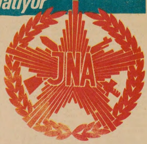
Yugoslavya Silahlı Kuvvetler arması.

Büyük fabrika ve işletmelerin kendi silahları, birlikleri, hatta uçaksavarları vardır