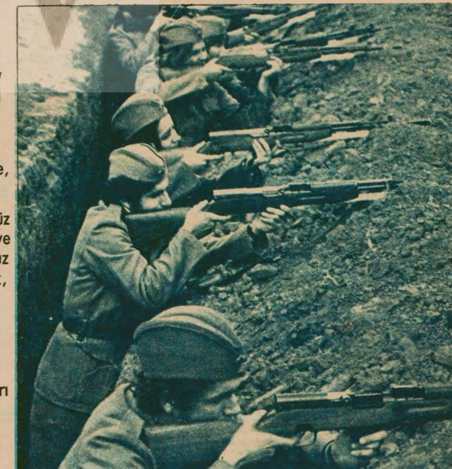
Kadın-erkek bütün halk silah kullanmasını öğrenerek, düşmana karşı tetikte Yugoslavya'da halkın silahlanmasına dayanan bir milli savunma sistemi var.

Bazı ülkeler jeopolitik durumları doğal kaynakları ya da nüfusları yüzünden çok özel bir duruma sahiptirler