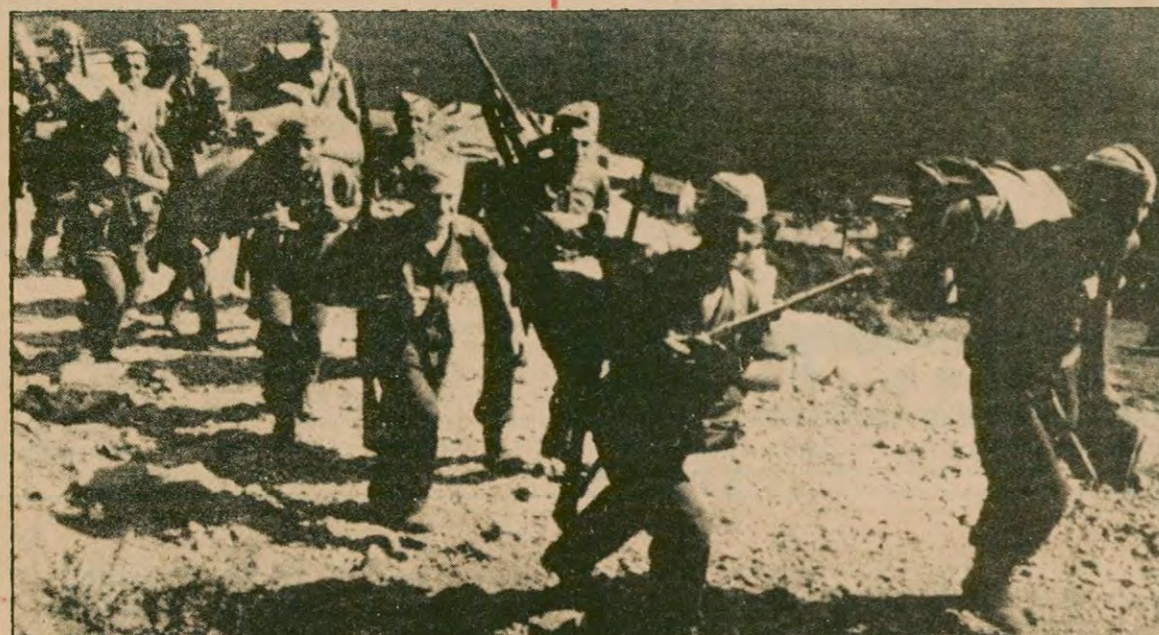
Yugoslav Partizanları anti-faşist savaşta mucizeler yarattılar. İşgali Alman ve İtalyan birliklerini bozguna uğratarak, ülkelerinin tarihlerine şanlı sayfalar ektiler.