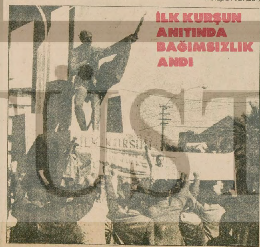
İLK KURŞUN ANITINDA BAĞIMSIZLIK ANDI

Rus savaş gemilerinin Dolmabahçe'ye demir atması büyük tepkilerle karşılandı. Üç gündür İstanbul'da, Ankara'da, İzmir'de ve Türkiye'nin dört bir yanında yüreği bağımsızlık aşkıyla dolu olanlar, protesto gösterileri yapıyorlar. Türkiye'nin birçok sendika ve kuruluşunun yöneticileri, Rus gemilerine karşı "İstemiyoruz" diye haykırıyorlar. Sosyal-empyalistler, hükümetin teslimiyetçiliğine bakarak, Türkiye'de ellerini kollarını sallayarak dolaşabileceklerini sanıyorlardı. Ama umdukları dağlara karlar yağdı. Türkiye'de sert kayaya çarptıklarını gördüler. Türkiye, sosyal-empyalistlerin yutabileceği bir lokma değildir. Bunu bu ilk ziyaretleriyle gördüler. Bundan sonra görecekları ise, daha açık ve sert olacaktır. Türkiye halkının büyük çoğunluğu bu hissi duyar ve bu mücadeleyi yürütürken, hükümet ve çevresi halkın tepkilerini yumuşatmaya çalıştı. Zaten amaçları Rus askerlerini ülkemizde dolaştırarak ilerde verecekleri tavizlerin zeminini yaratmaktır. TRT de hükümetin bu politikasına bağlı olarak Rus gemilerine karşı yükselen seslere hiç yer vermedi. Dünyanın dört bir yanındaki çok daha önemsi olayları haber diye verirken, (Devamı Sa. 7, Sü. 9'da) Aydınlık