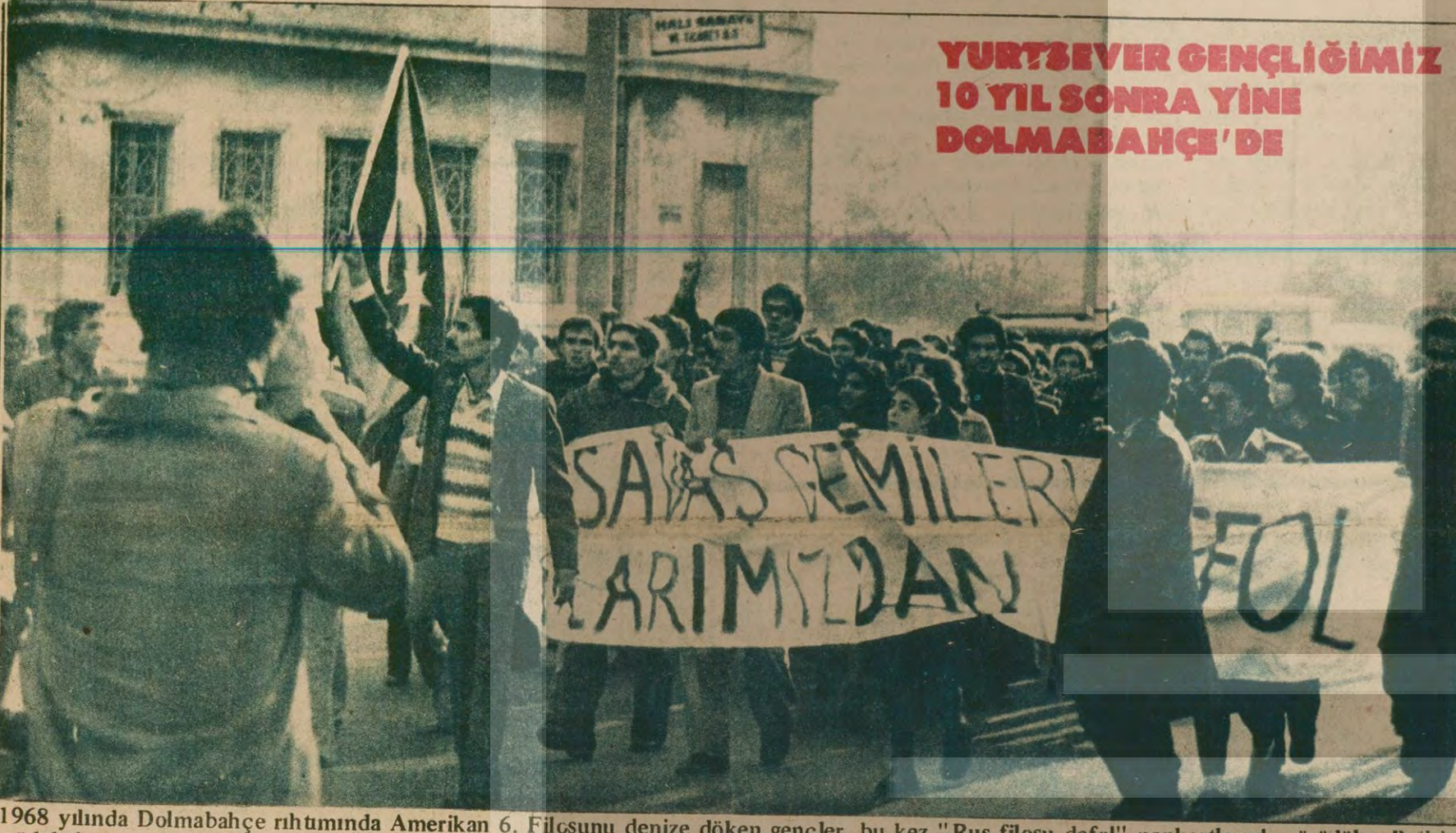
YURTSEVER GENÇLİĞİMİZ 10 YIL SONRA YİNE DOLMABAĞÇE'DE

TIKP: "Bütün halkı, partileri, kitle örgütlerini, sendikaları ve basını çağırıyoruz"