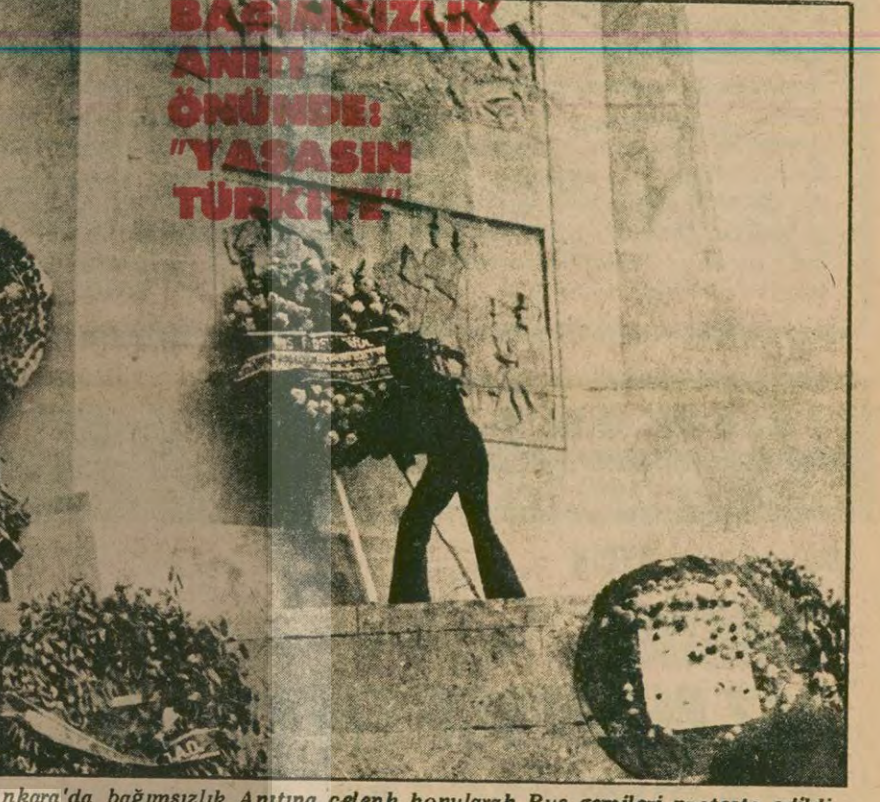
Ankara'da bağımsızlık Anıtına çelenk konularak Rus gemileri protesto edildi. Kurtuluş Savaşının simgesi mermi taşıyan anıtın önünde bir ağzdan haykırıldı. "YASASIN TÜRKİYE"

Çanakkale içinde vursunlar bizi İster Dolmabahçe'de kırsınlar bizi Uçakla, gemiyle sarsınlar bizi Halk bitmeden bu savaş bitecek sanma.