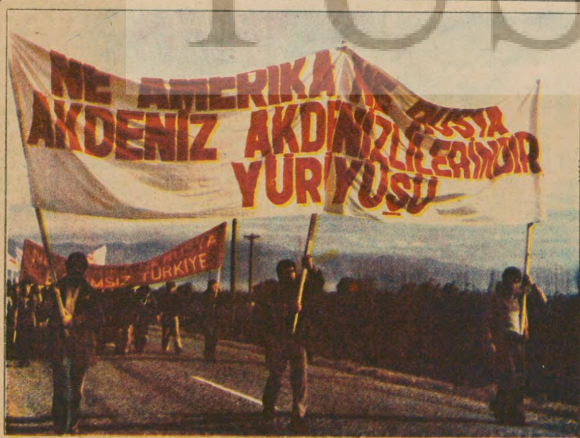
Türkiye halkı, denizlerinde emperyalist zırhlıları istemiyor. Kurtuluş savaşında İngiliz zırhlılarını, on yıl önce 6. Filoyu kovan halkımız şimdi de Sovyet sosyal-emperyalizmine karşı bağımsızlık bayraklarını yükseltiyor. İşte iki yıl önce Ege'deki yürüyüş: 'AKDENİZ AKDENİZLİLERİNDİR!'