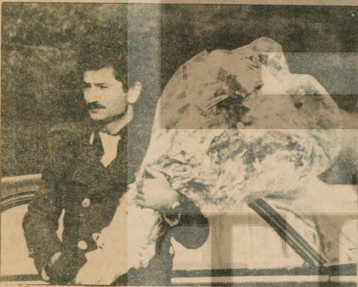
Bir köşeye dikilmiş, Askeri kordon altında efendilerine birşeyler sunmak istiyor. Onun gibilerinin usaklıkları değil, Türkiye halkının iradesi tayin edecektir, ülkemizin geleceğini.