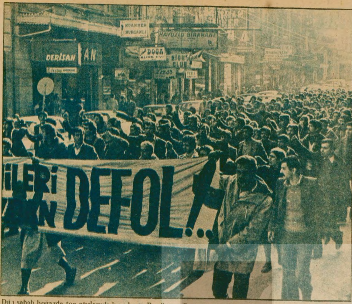
Dün sabah boğazda top atışlarıyla karşılanan Rus Savaş Gemileri, tüm Türkiye'de tepki ile karşılandı. İstanbul'da Rus Savaş Gemilerini protesto eden devrimci gençler, "Rus Savaş Gemileri kıyılarımızdan DEFOL!" yazılı pankart taşıdılar.

Rus filosu Komutanı, yoğun polis ve asker kordonu altında karaya çıkabildi