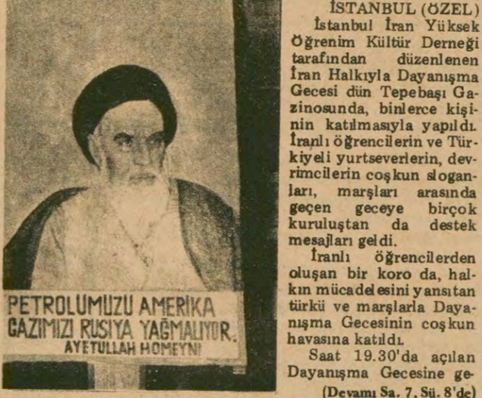
İran Halkıyla Dayanışma Gecesi'nin yapıldığı Tepebaşı Gazinosunun girişinde Ayetullah Homeyni'nin portresi ile iki süper devletin yağmacılığı vurulayan sözlerinin yer aldığı bir pano asılmıştı.