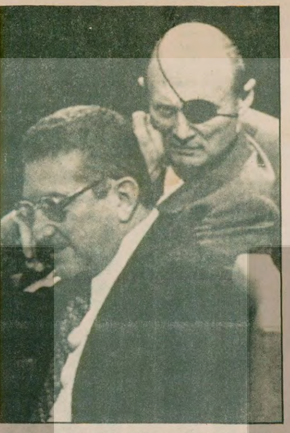
Mısır-İsrail görüşmelerinin çıkmaza girmeye yüz tutması ve aralarındaki anlaşmazlığın büyümesi üzerine Dayan ve Weizmann İsrail'e çağrıldılar.

ABD başkenti Washington'da iki haftadır süren İsrail-Mısır görüşmelerinde anlaşmazlık-