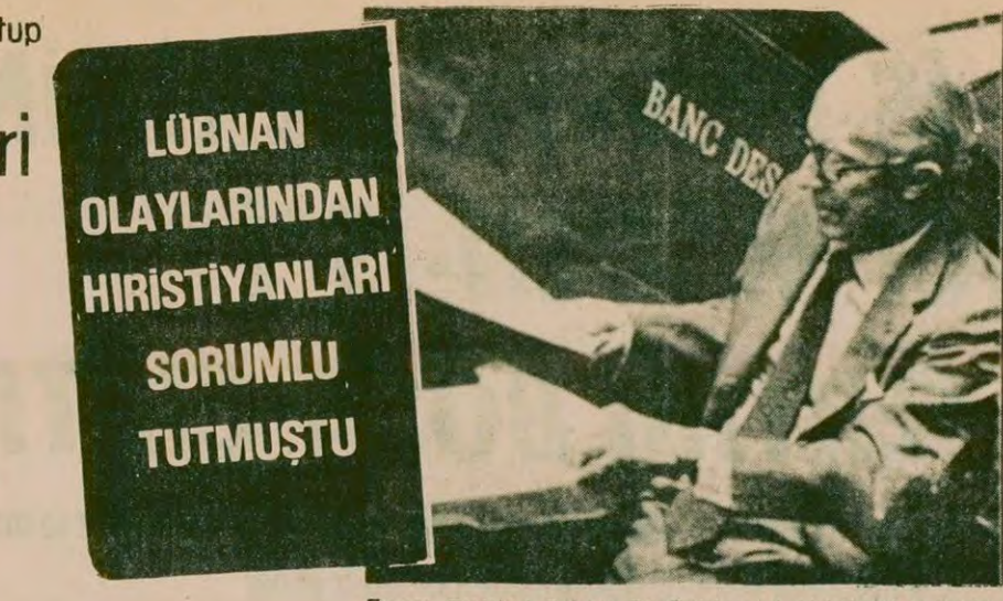
Fransa Dışişleri Bakanı De Guiringaud, Hristiyanları suçlayanca simlekleri üzerine çekti. Daha simdiden yeni dışişleri bakanı aranıyor.

Komisyon sözcüsü Robert Burke, bu dört önemli deniz yolunun kontrol altına alınması için hazırlanan ayrıntılı bir planı, yakında AET Bakanlar Konseyine sunacağını söyledi. Sovyetler Birliği'nin bugün dünya deniz taşımacılığında altıncı sırada yer aldığı belirtilen Burke, Rusya'nın 1970 ve 1975 yılları arasında taşı-