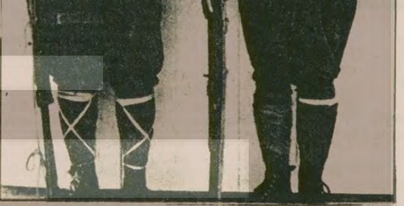
Yugoslavya Komünist Partisi'nin yürüttüğü silahlı mücadele içinde kadın yeni kurulan bölgeyi orantıyor. Fotoğrafta Tayland'daki devrimci mücadeleyi simgeleyen bir görüntü: Kar-koca bir çift.

Filipinler Devlet Başkanı Ferdinand Marcos ve Kamboçya Dışişleri Bakanı Ieng Sary arasında imzalanan anlaşmada, bağımsız bir Kamboçya'nın, bölgede barışın korunması açısından gerekli olduğu vurgulanıyor.